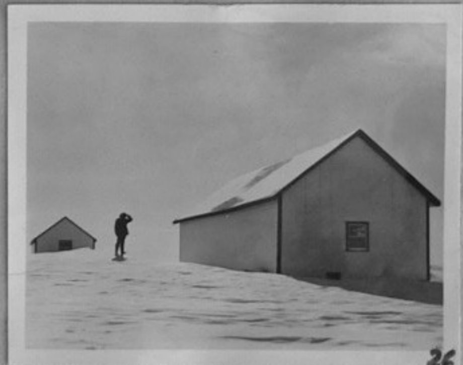
69-2262-25-Изоставени ескимоски колиби западно от Хадзъм Бей.