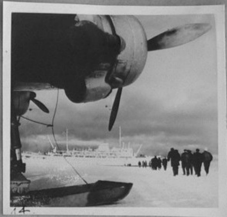
14-Самолет от полярната авиация за участниците в 9 съветска антарктическа експедиция, дошла с парахода "Естония".