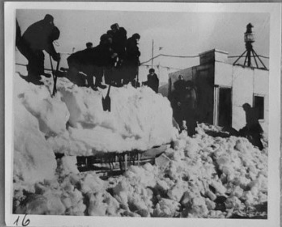
16-Разчистване на засипаните от сняг жилища.