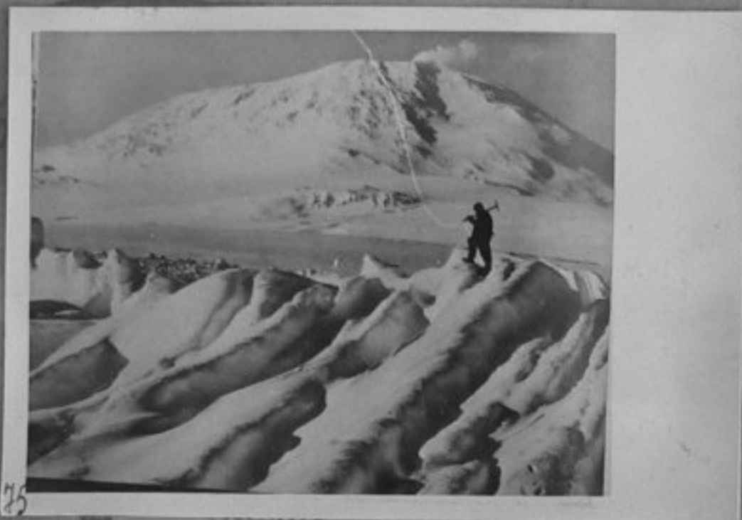
61/2103-75-Вулканът Еребус на о-в Рос.