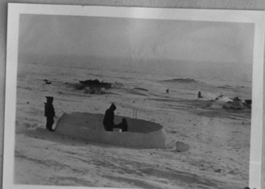
69-2262-23-Ескимоско селище на източния бряг на Хадзъм Бей. /репр./ /ИК