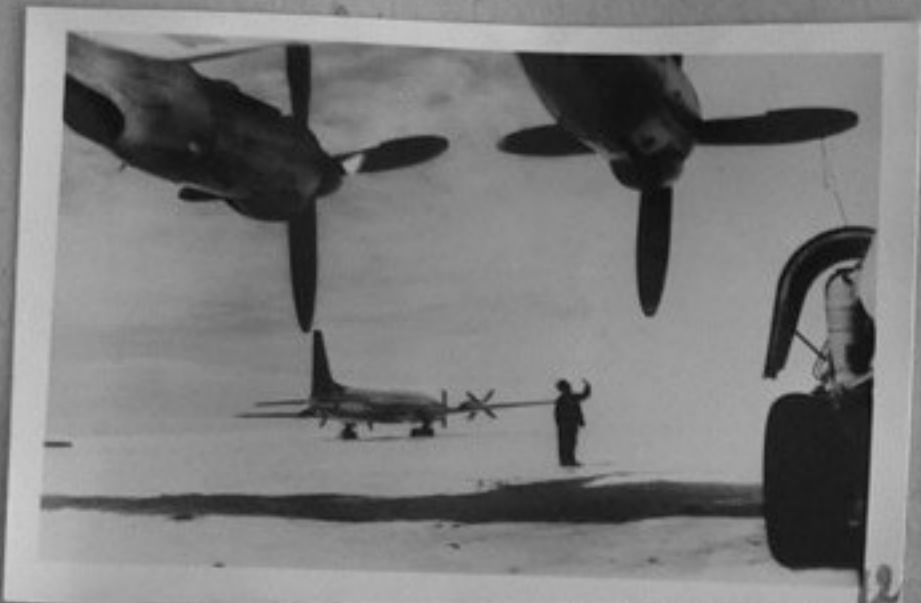
72-2578-12-Съветски въздушни лай- нери в Антарктида.