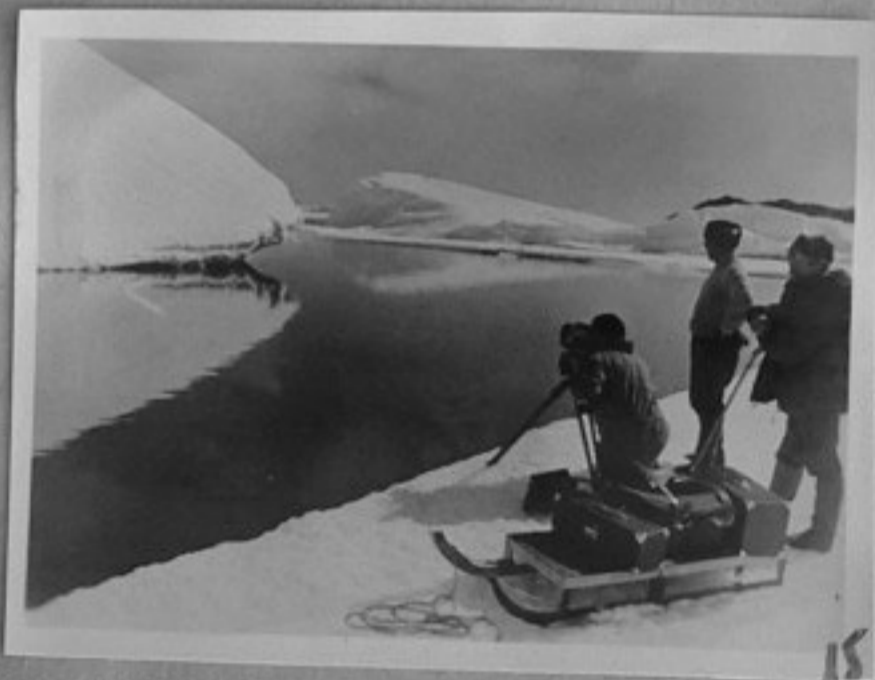
72-2578-15-Заснимане на антарктически сюжети.