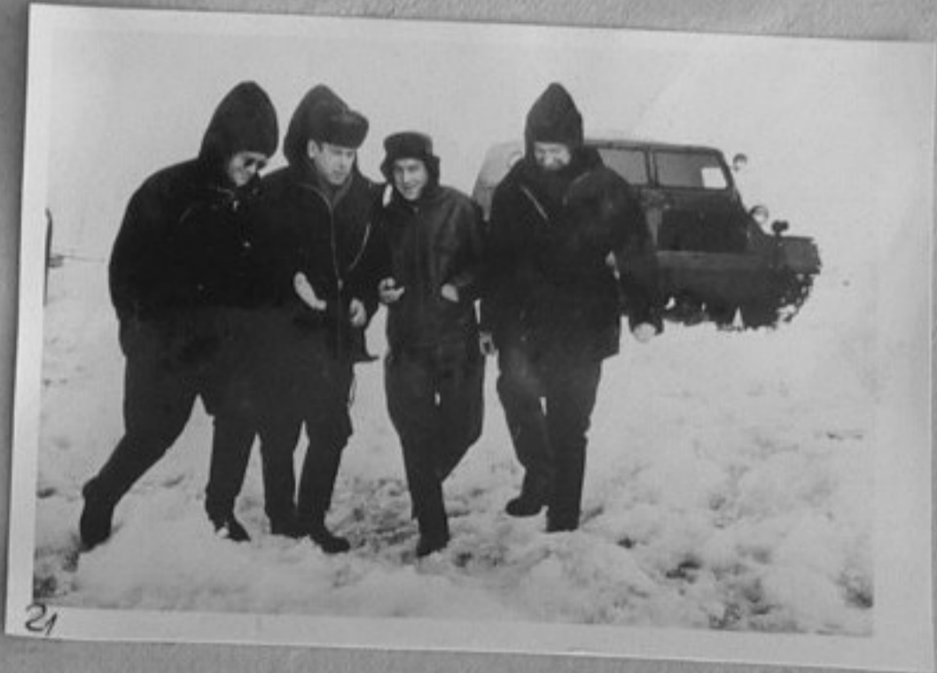
21—Група участници в 9 съветска аркт. експедиция.