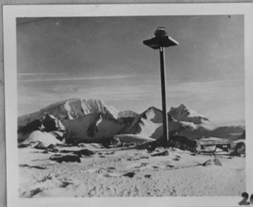
69-2262-20-Хоп Бей, земя Грейъм, британска база, установена тук от 1952 г. /репр./ /ИК