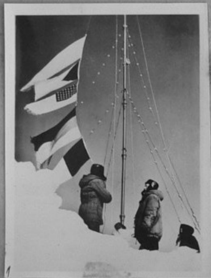
1-Издигане знамената на държавите, чиито специалисти участват в работата на станцията "Восток".