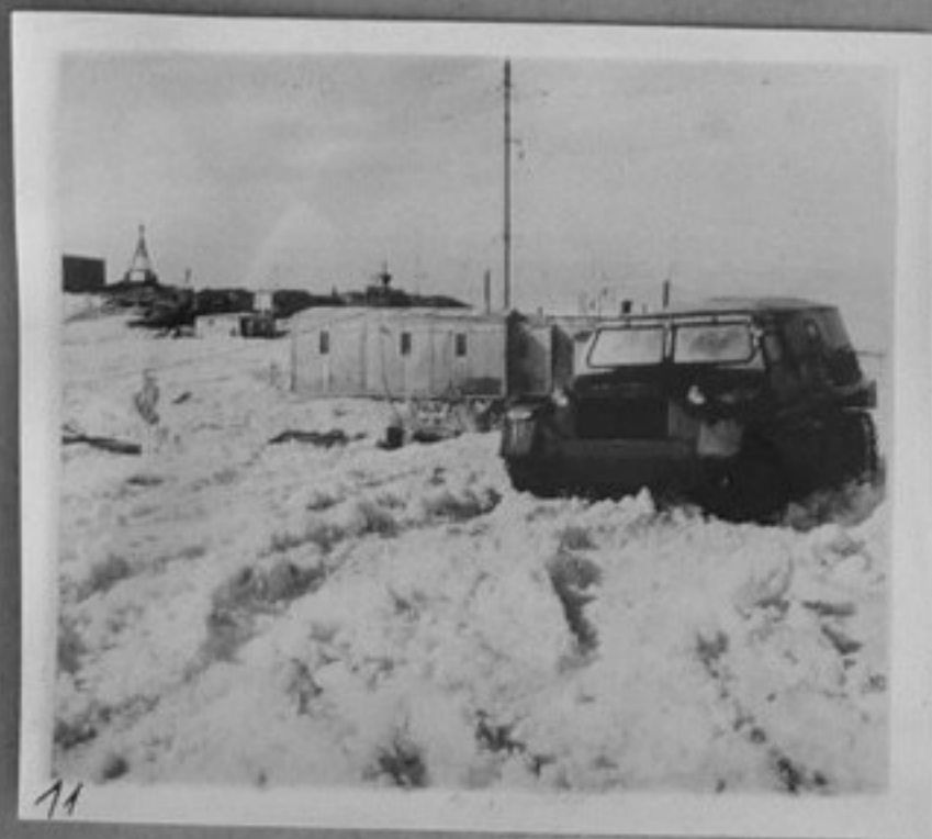
11-Обсерваторията в Мирний.