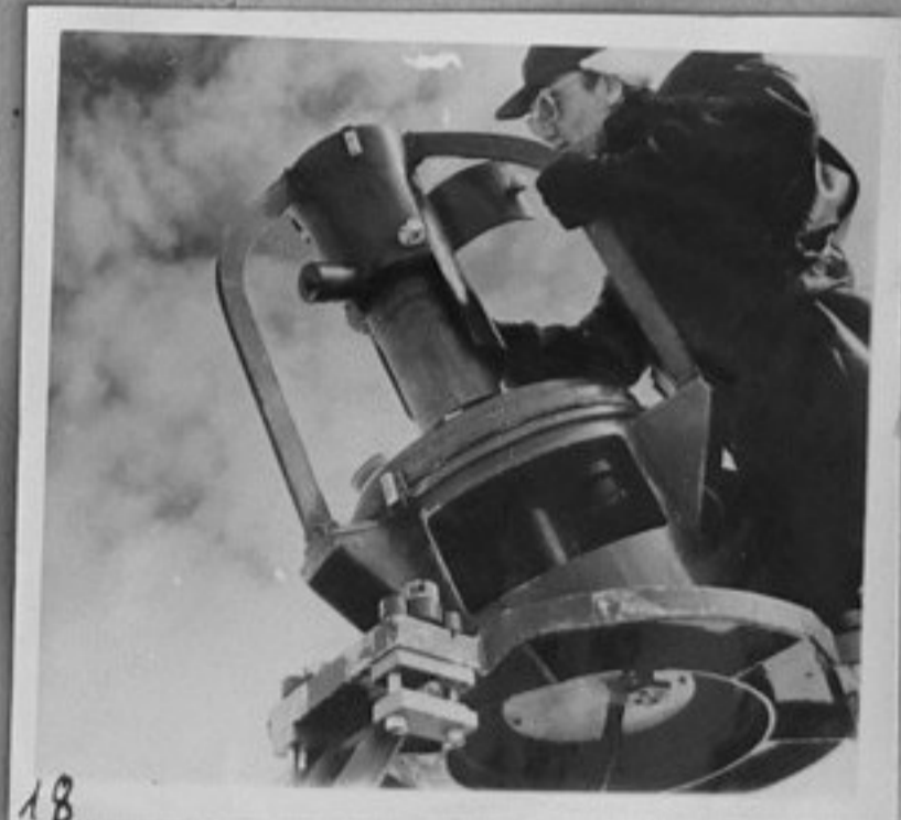
18-Подготовка на камерата за снимки на полярното сияние.