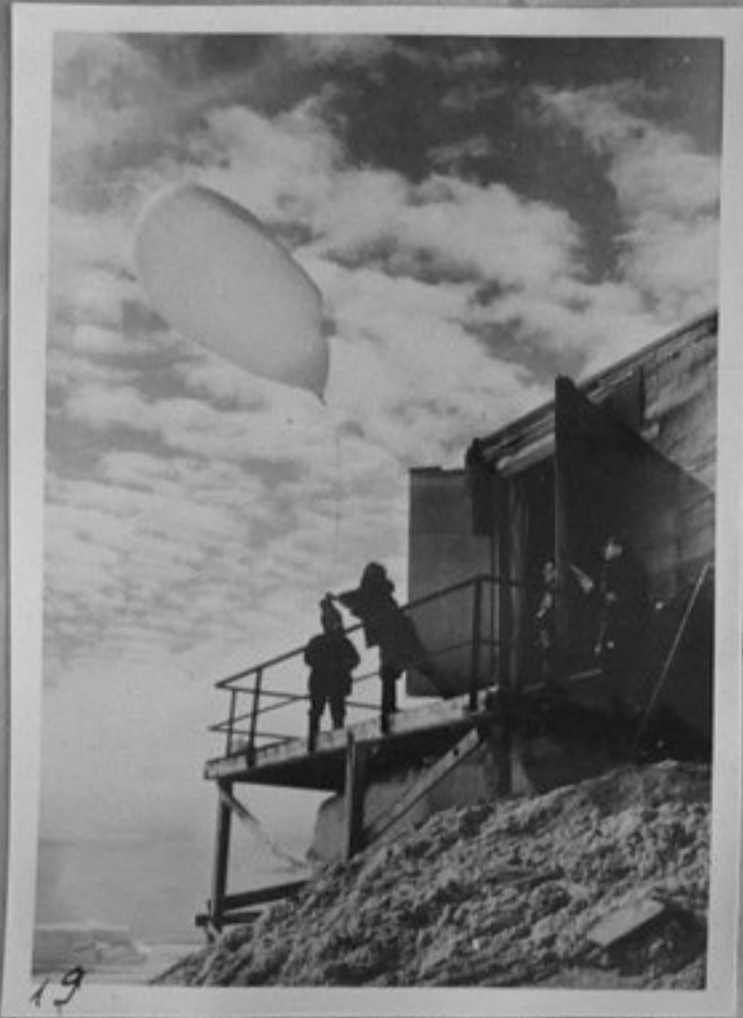
19—Пускане на радиосонди в горните слоеве на атмосферата за измерване интензивността на космическите лъчи.