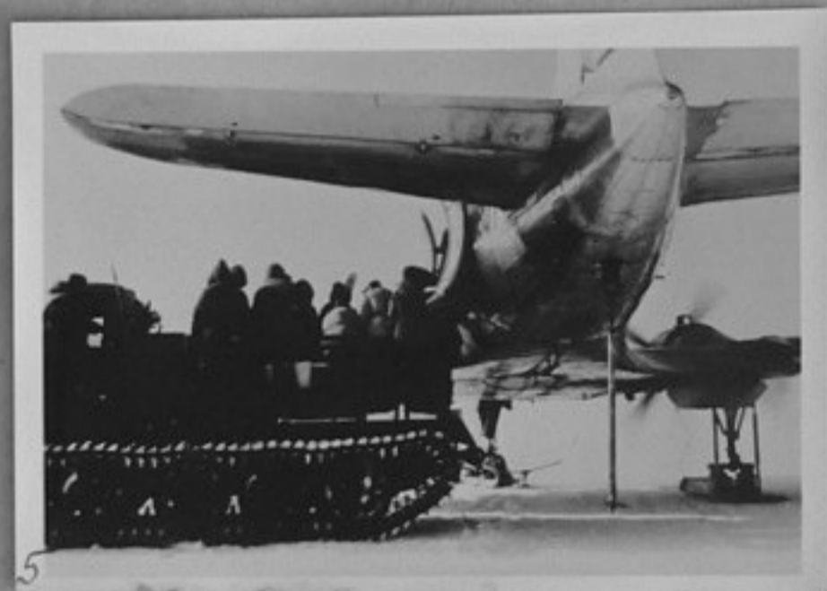
5-Разтоварване на самолет, който е донесъл стоки за станцията "Восток".