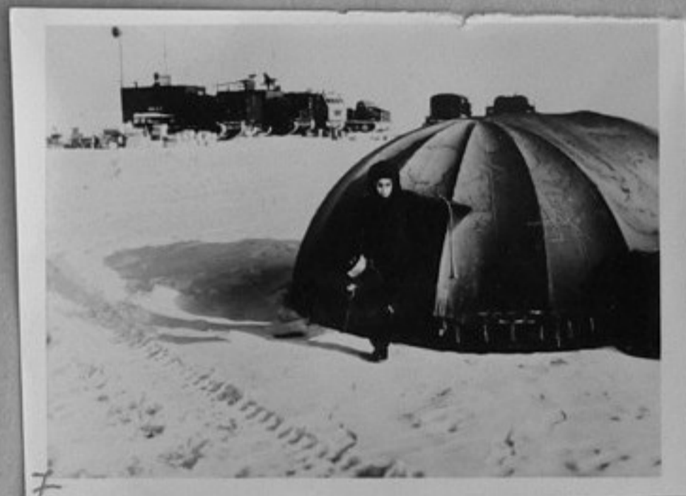
7-Изглед от лагера на станцията "Восток".