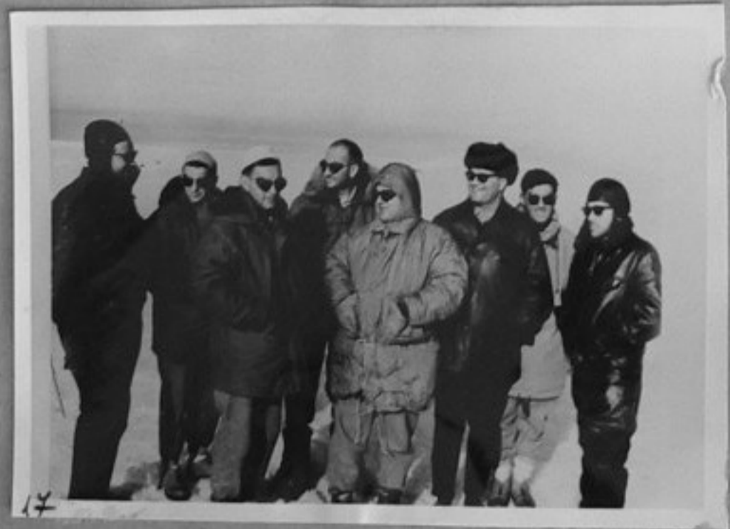
17- Група учени от общата съветско-френска глациологическа група.