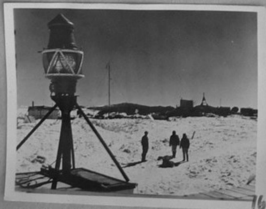
72-2578-16-Спасителният фар в се- лицето "Мирний" в Антарктида.