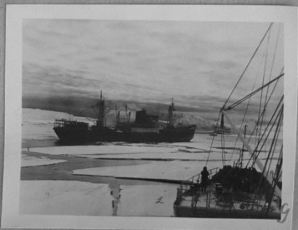
72-2578-9-Ледовете на Антарктида.