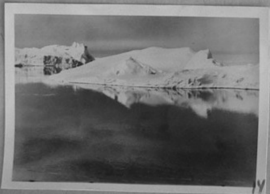
72-2578-14-Антарктически пейзаж.