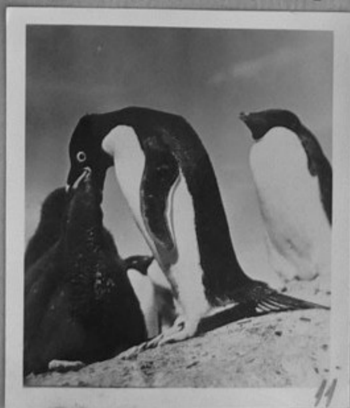
72-2578-11-Грижлива майка. Антарктида.