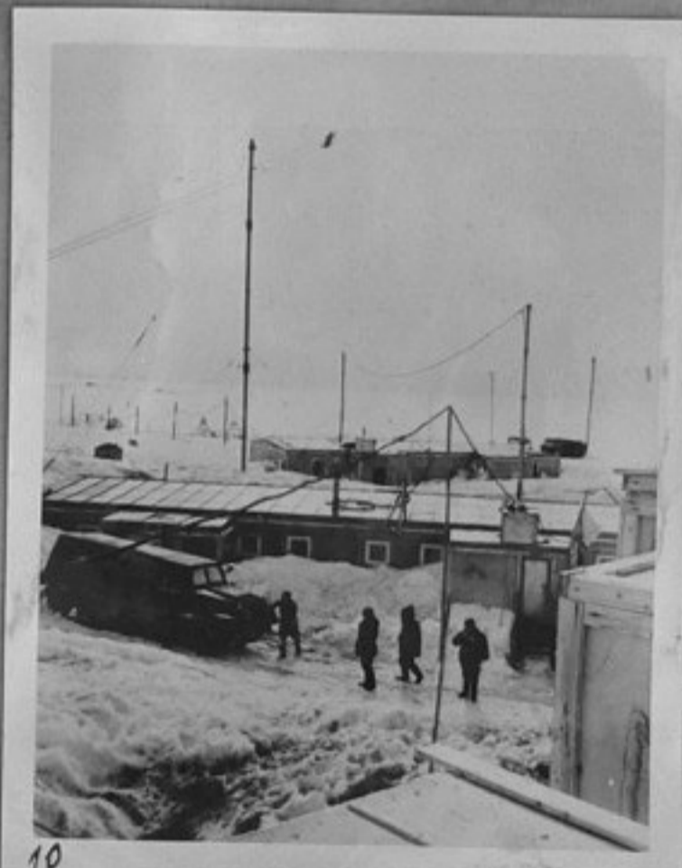
10-Жилища в Мирний.