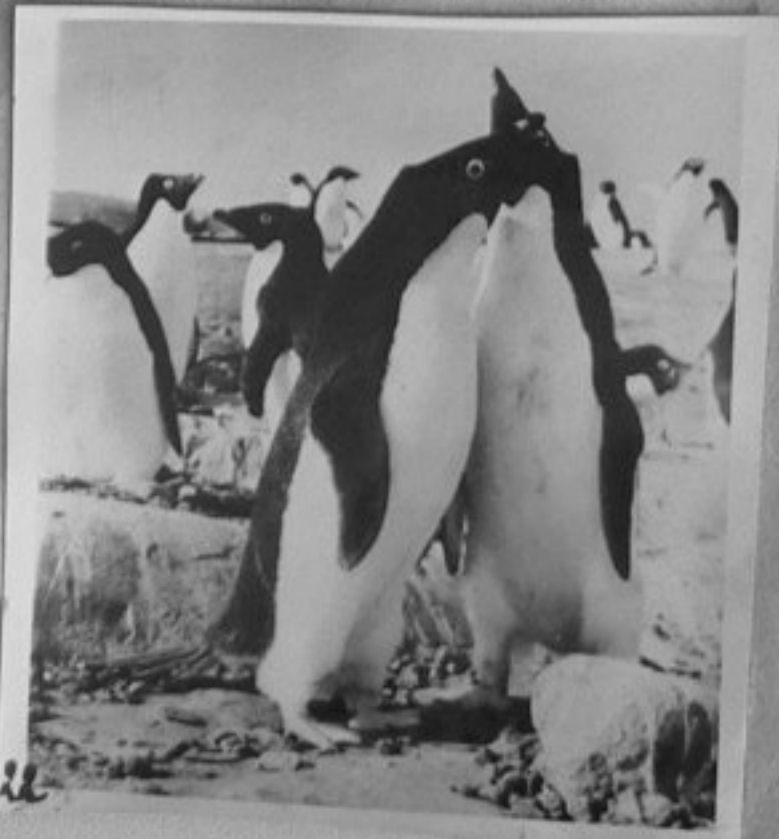
Пингвини в района на съветската станция "Мирний" в Антарктида. /ММ/