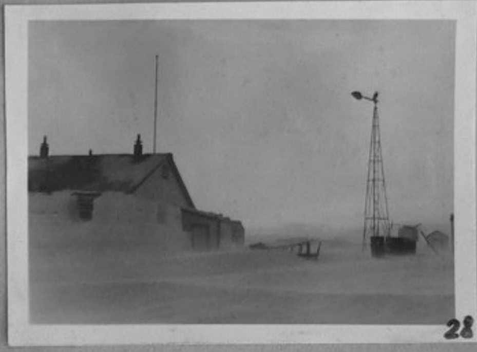
69-2262-27-Вятърна електрическа станция в Копермайн, Северна Канада. /репр./ /ИК