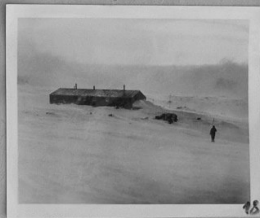
69-2262-18-Базата Хът на Хоп Бей. /репр./ /ИК