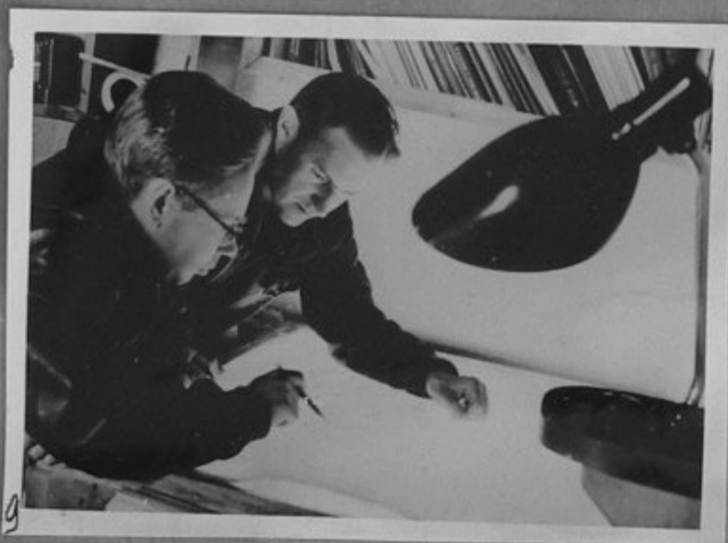
9- В обсерваторията Мирний. Обсъждат прогноза за времето.