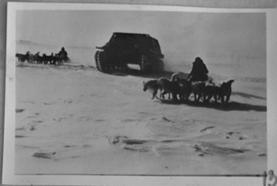
72-2578-13-Из Антарктида.