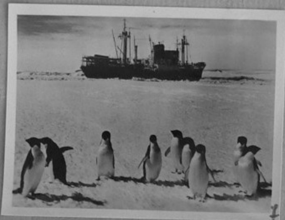
72-2578-7-Съветски параходи в Антарктида.