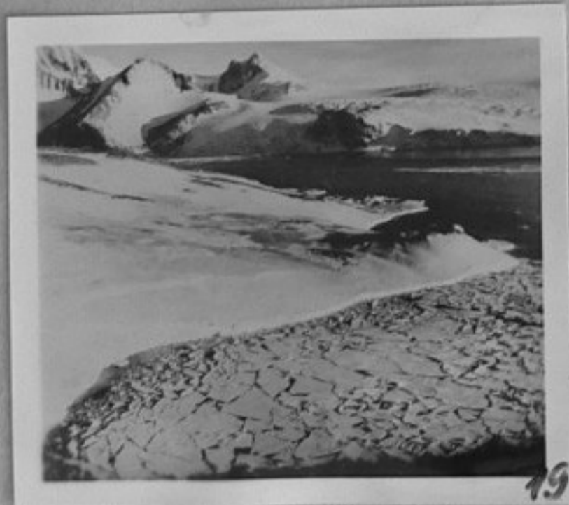
69-2262-19-Летен антарктичен пейзаж на Идгъ Коув, Хоп Бей, земя Грейъм. /репр./ /ИК