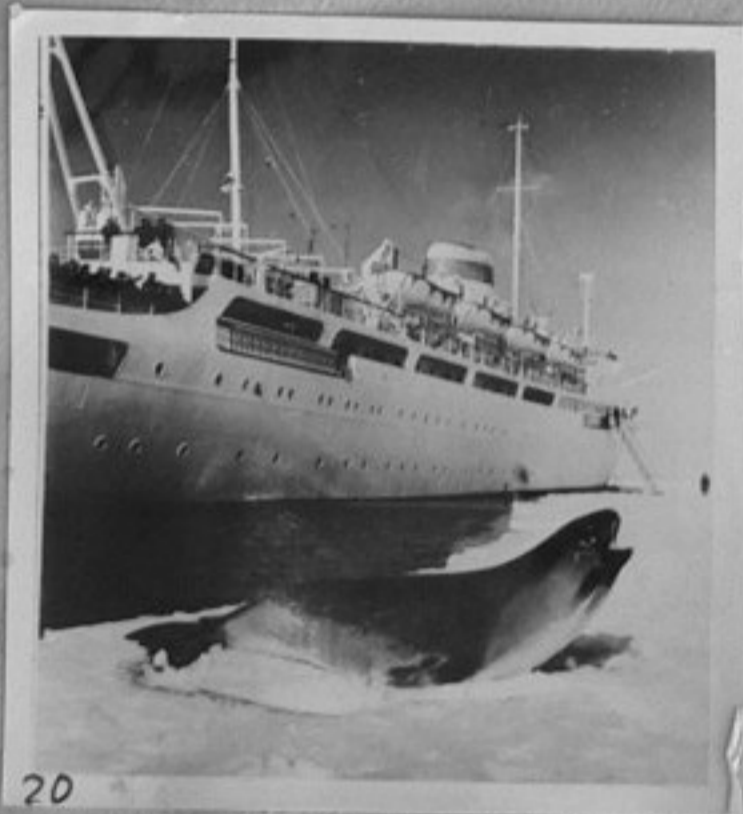
64/532-20,23 - Паруходът "Естония" довел в Антрактида участниците от 9 съветска антарктическа експедиция. /24/36 ММ/