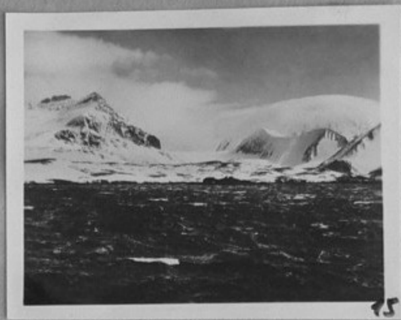
69-2262-15-Изглед от Антарктида. /репр./ /ИК