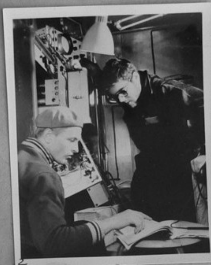
4-Част от съветските и чуждестранни специалисти от станцията "Восток".