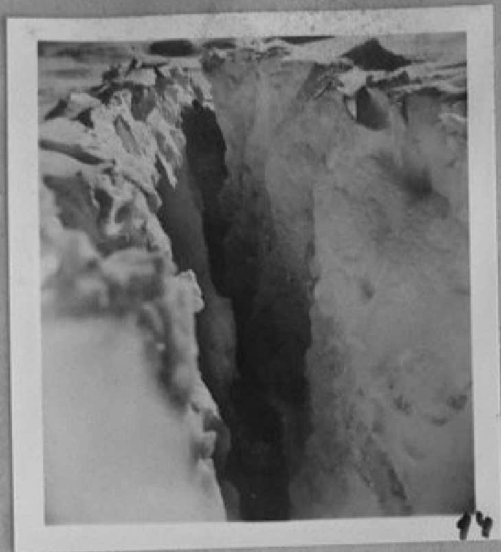
69-2262-14-Ледникова цепна-тина на Дъз Бей в Земя Грейъм. /репр./ /ИК