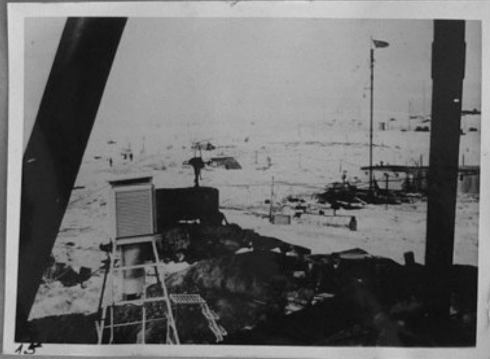
15-Изглед на обсерваторията "Мирний".