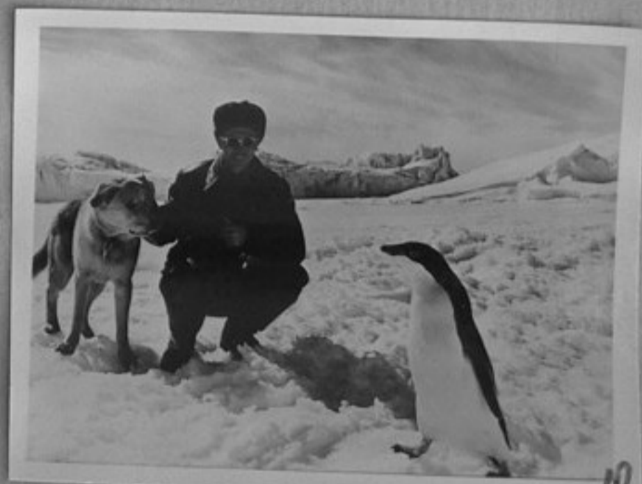
72-2578-10-Запознанство в Антарктида.