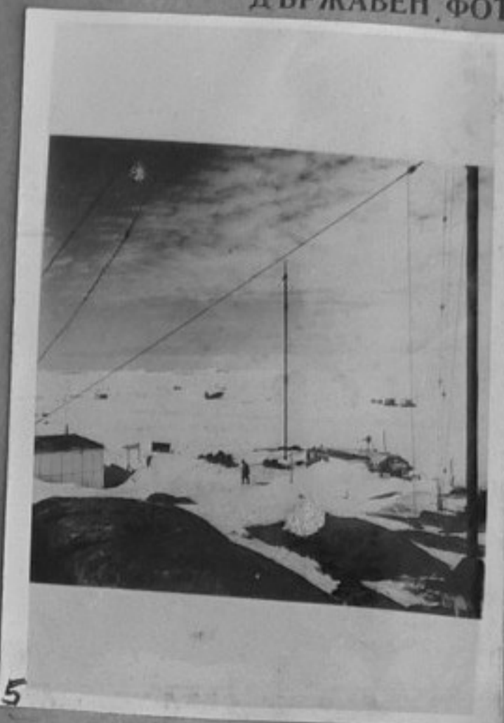
62/457-5-Антарктида. Общ изглед на селището Мирний. /ММ/