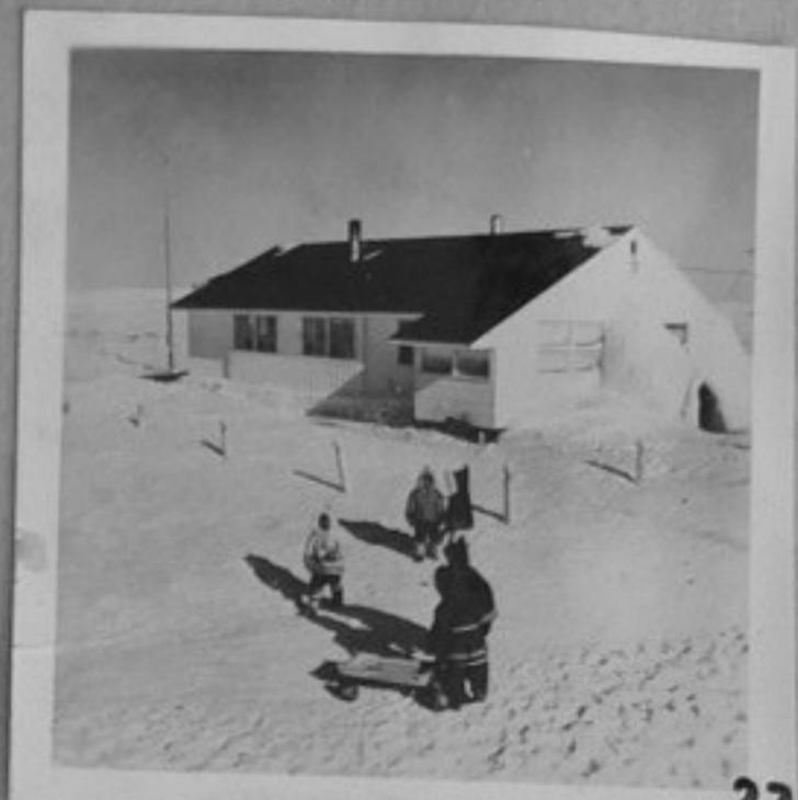
69-2262-21-Антарктичен пейзаж. /репр./ /ИК