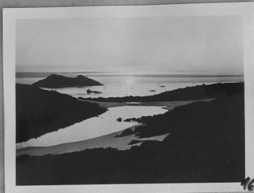
69-2262-16-Нощен изглед от остров Хоросис хое на около 500 мили от британската база в Хоп Бей.