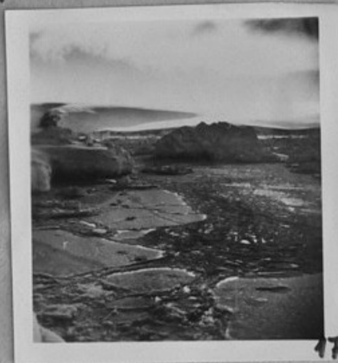
69-2262-17-Ледени блокове близо до Хоп Бей.