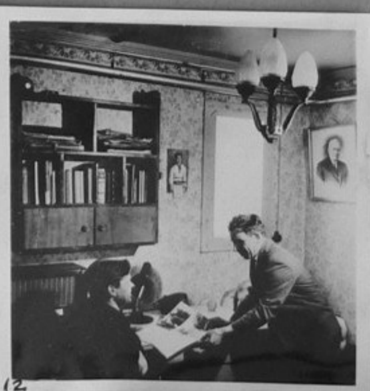
12-Въпреки суровата зима на Антарктида, снежните бури и дългата полярна нощ, в домовете на изследователите е топло и уютно.