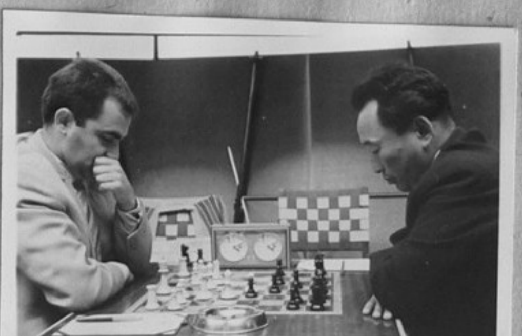
31-Пьедевски/България/ - Пиревжав /Монголия/.