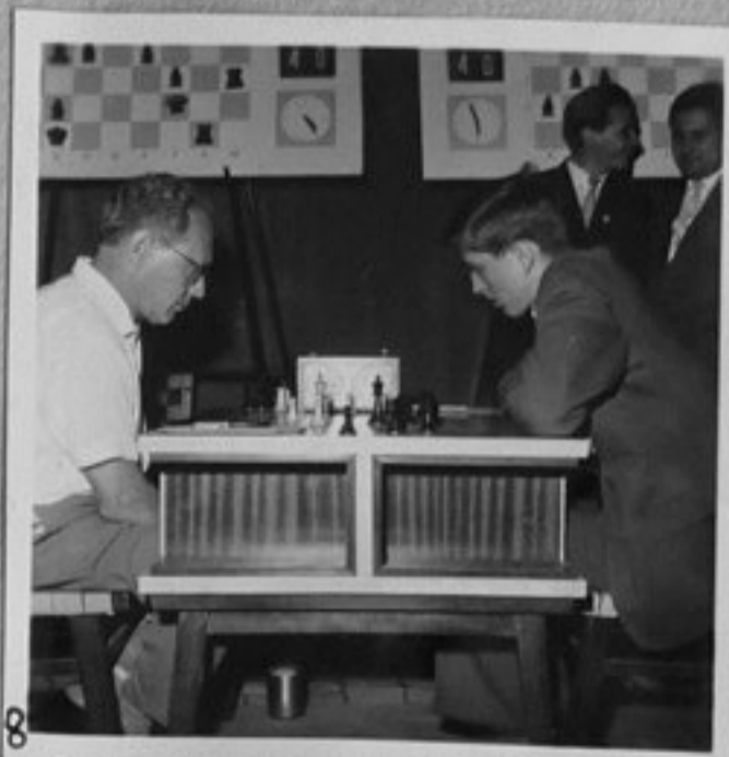
8-Срещата Ботвиник-Фишер. Гонгът е уж рил, партията се отлага.