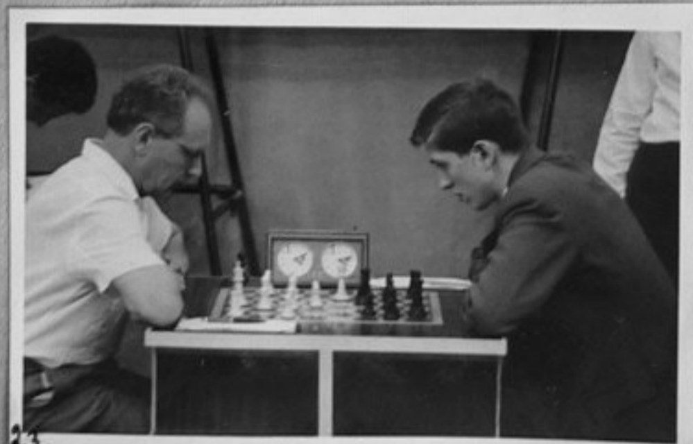
23-Както кадър 3.