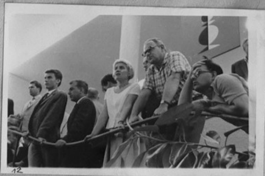
12 12-Зрители в залата.