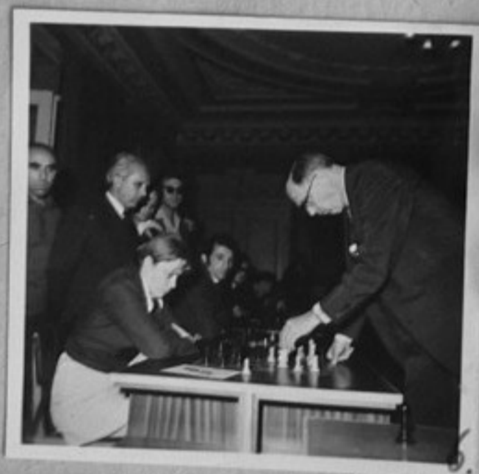
73-3914-6-Президентът на Международната шахматна федерация д-р Макс Еве се "сражава" с 20 български шахматисти.