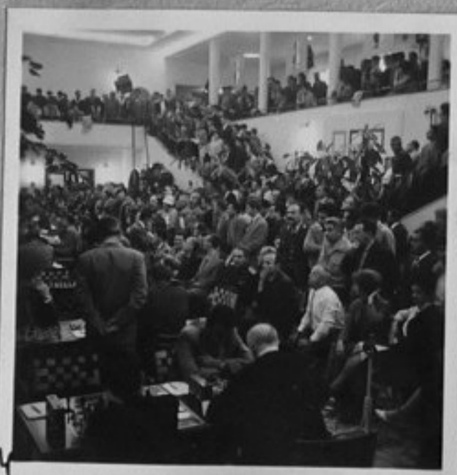
4-Изгледи от залата.