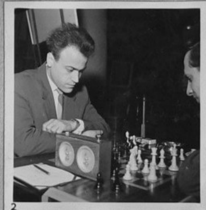
63/545-2-Гросмайсторът Милко Бобоцов. /Бурно в/ ММ