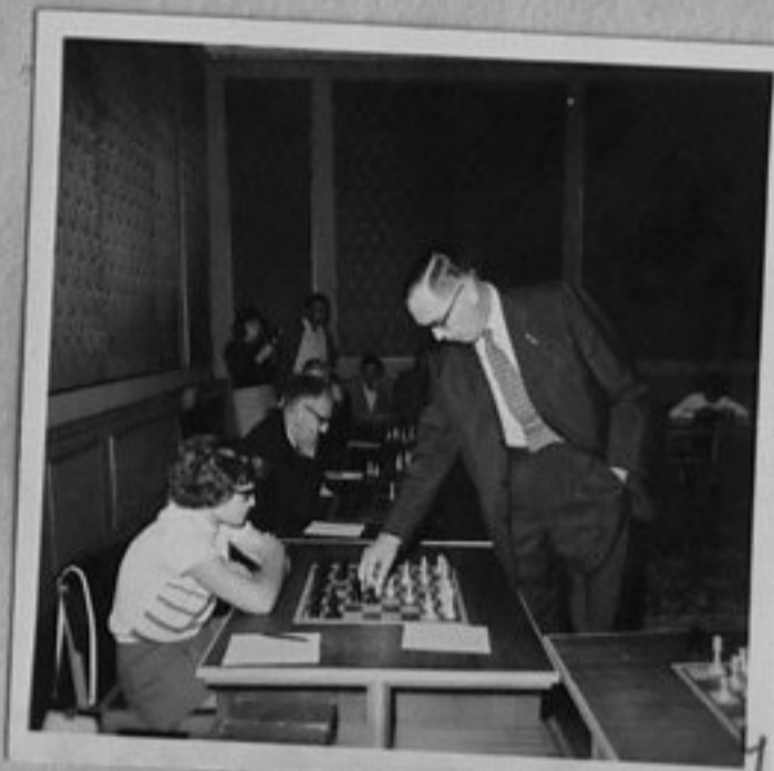
Президентът на Международната шахматна федерация д-р Макс Еве се "сражава" с 20 български шахматисти. 73-3913-10-Момент от среща- 73-3914-3,4-Моменти от срещата.