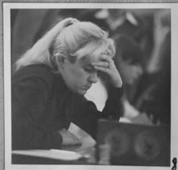
71-5176-8,10-Турнир по шахмат в международния младежки център-Приморско.