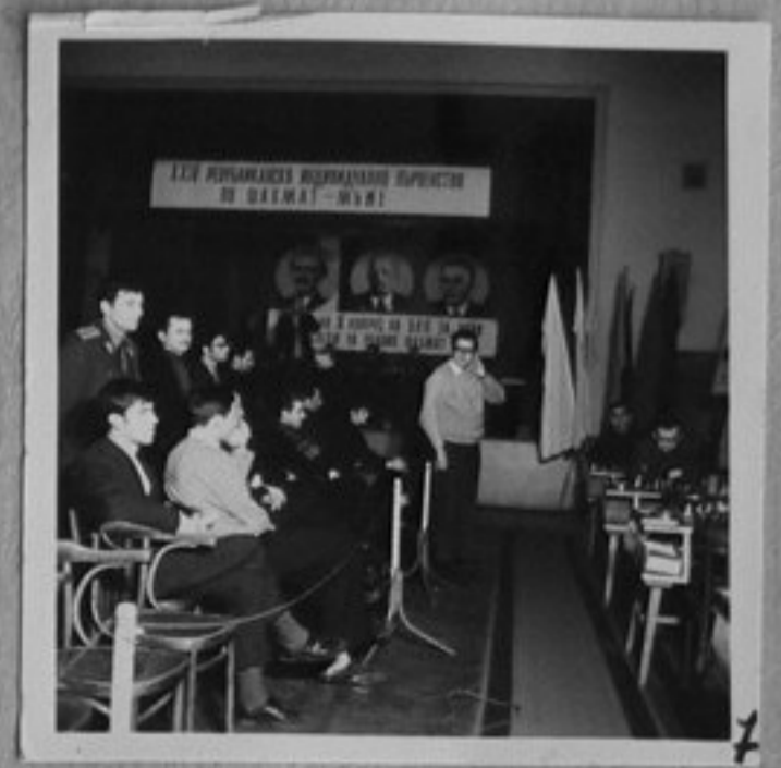
71-617-7-По време на първенството.