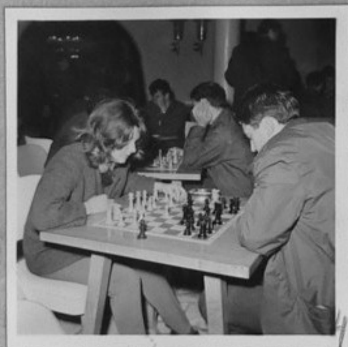
66/3859-4,10 - Петхилиден събор-семинар на младежите първенци от село в курорта "Златни пясъци"! И шахматистите са в действие. ЕИ