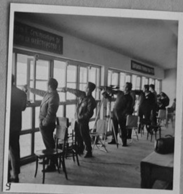
9 64/1841-9 - Състезание - стрелба с пистолет. /Любомиров/ ММ