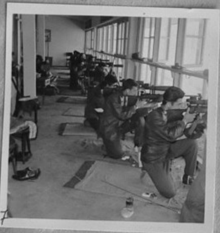
7 64/1903-7,9 - Състезание стрелба с пушка. /Любомиров/ ММ