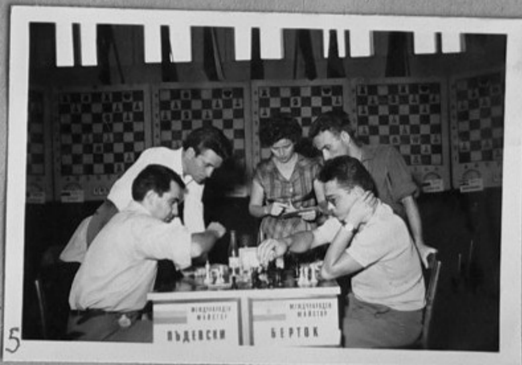
3-Международен предолимпийски турнир по шахмат, проведен в София.