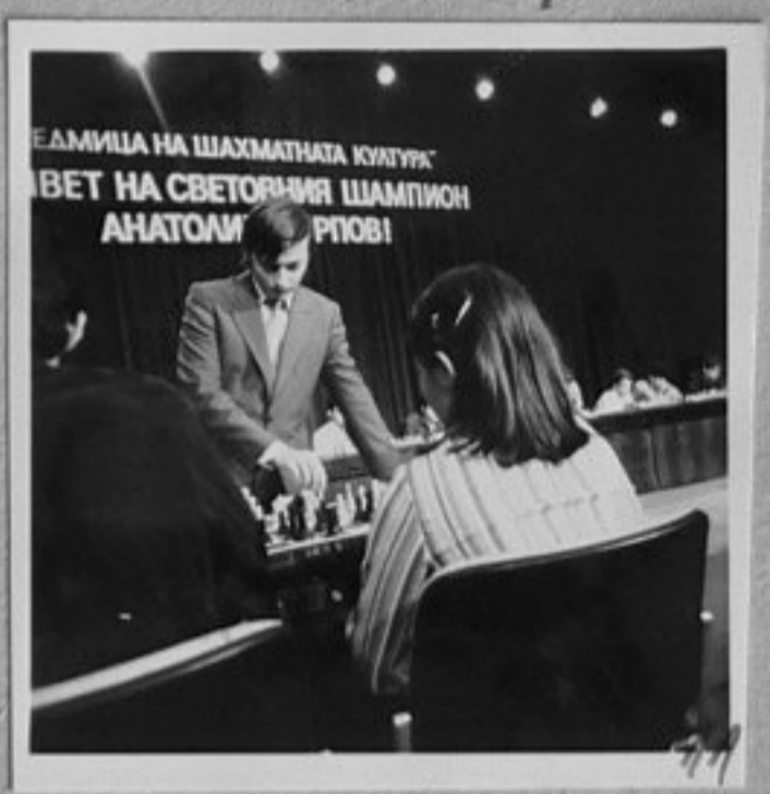
83-1314-8-Световният шампион по шахмат Анатолий Карпов.