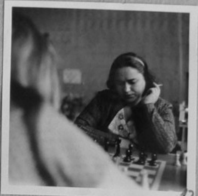
72-4444-10,11,12-Моменти от IV балкански игри по шахмат.