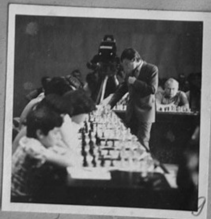
83-1312-9-Световният шампион по шахмат Анатолий Карпов.