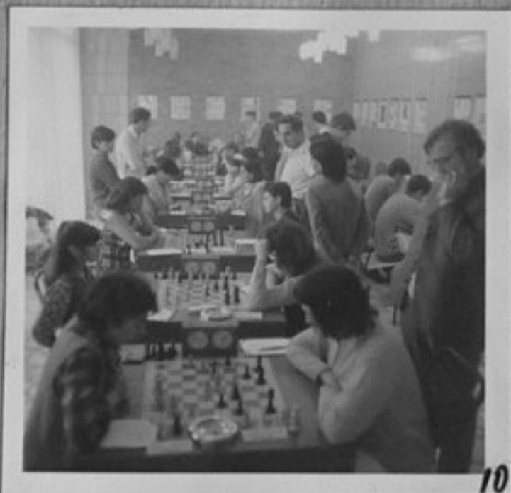
71-5175-10-Турнир по шахмат в международния младежки център-Приморско.