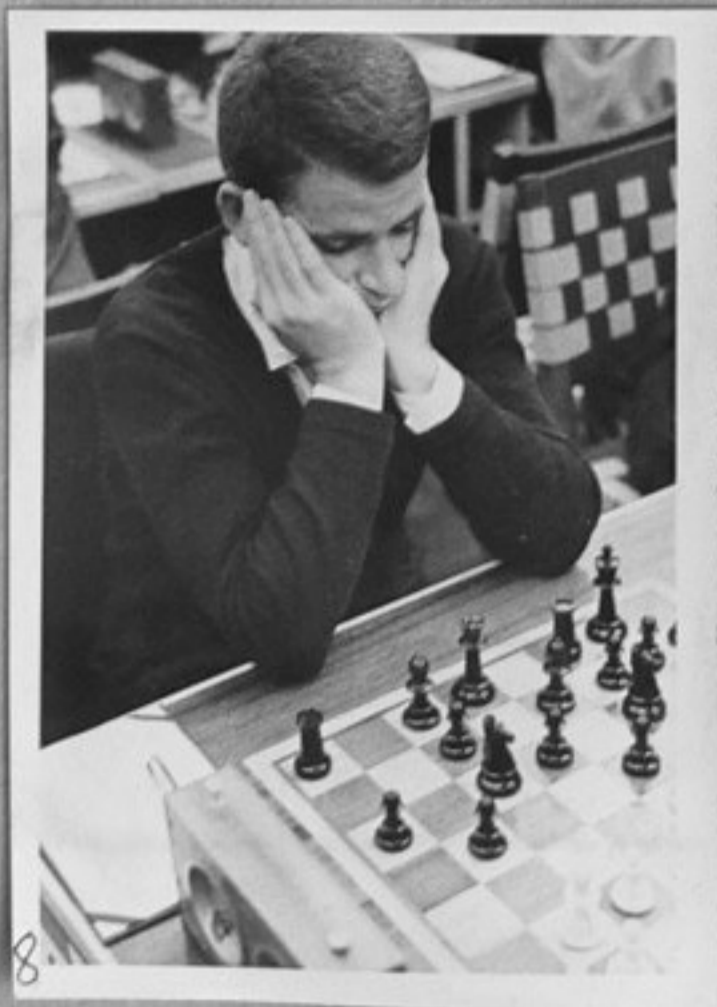
8. 62/2633-8-Както кадър 7.