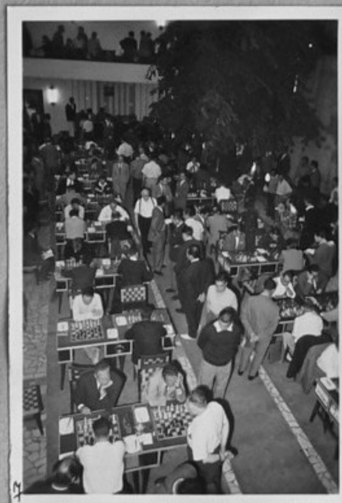
7-Общ изглед на залата.