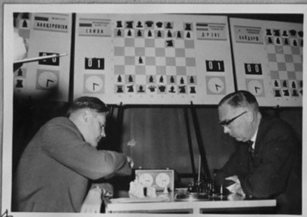
4 4-мгм Д-р Ебе /Холандия/ и Слива /Полша/.