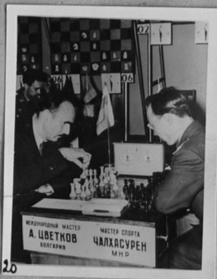
64/1166-20-Момент от срещата по шах между А. Цветков /България/ и Г. Чалхасурен /Монгolia/ в Москва от шампионата на дружествата при армиите от социалистическите страни-май 1964 год. /24/36/ ММ