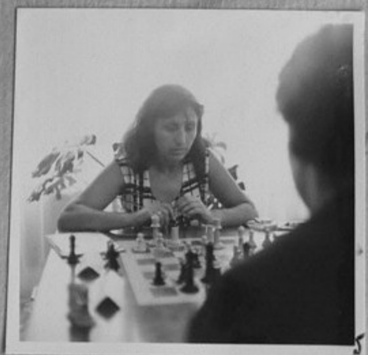
71-5176-5-Турнир по шахмат в международния младежки център-Приморско.