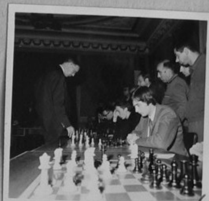
73-3913-4,5,6-Президентът на Международната шахматна федерация /ФИДЕ/ д-р Макс Еве /Холандия/ се "сражава" с 20 български шахматисти.