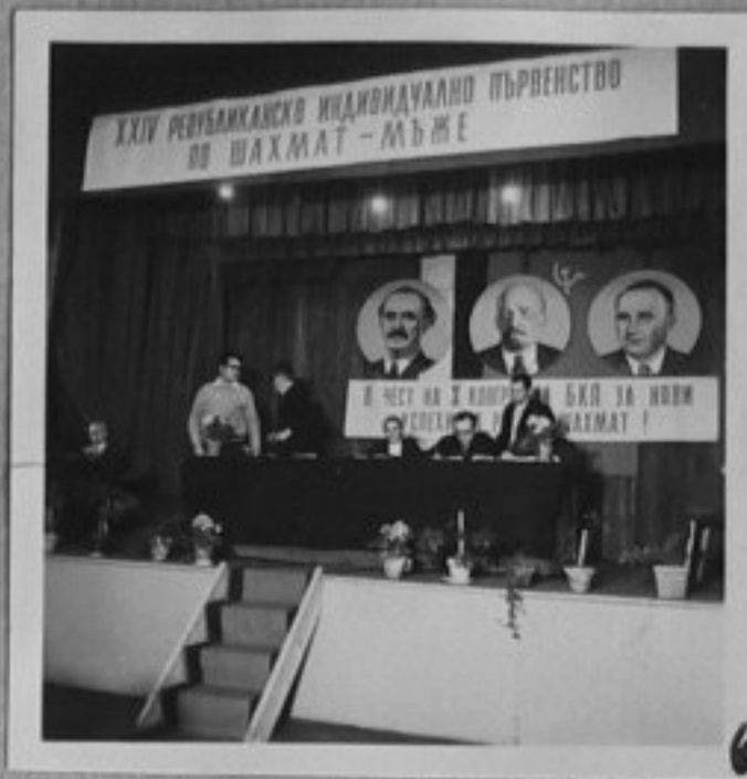
XXIV РЕПУБЛИКАНСКО ИНДИВИДУАЛНО ПЪРВЕНСТВО ПО ШАХМАТ - МЪЖЕ 71-617-6-Част от седмичната колежия.