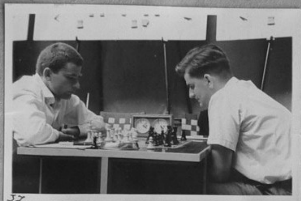
37 62/2745-37-Спаски/СССР/-Дарга/ГФР/. /Парушев/ ММ