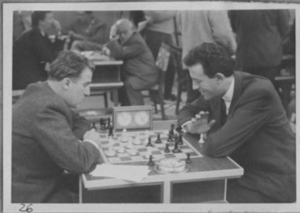
62/2956-26-Както кадър 23.