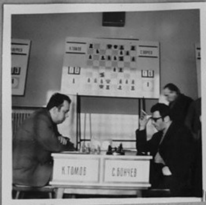
73-355-3,4,9-Провеждане на републиканското първенство по шах. /Кр.Узунова/ИК