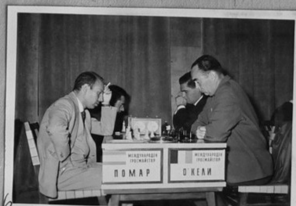
6 6-мгм Помар /Исландия/ и мм Пен розу /Англия/.