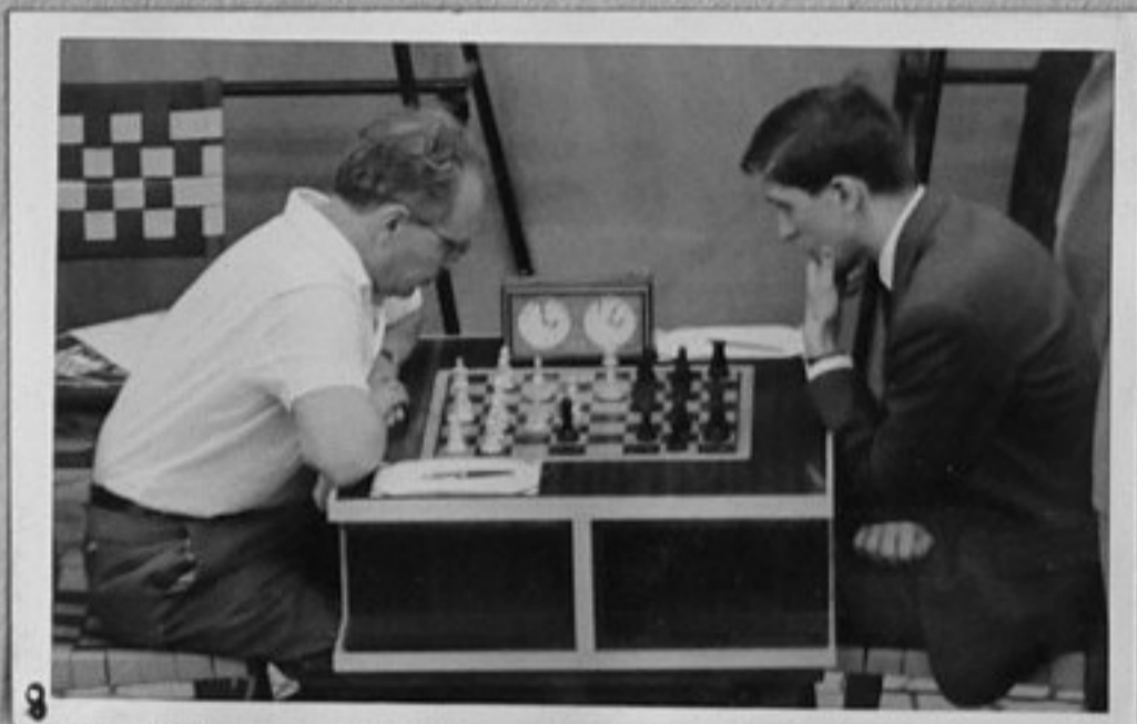
8-Ботвиник /СССР/ -Фишер/ САЩ/.