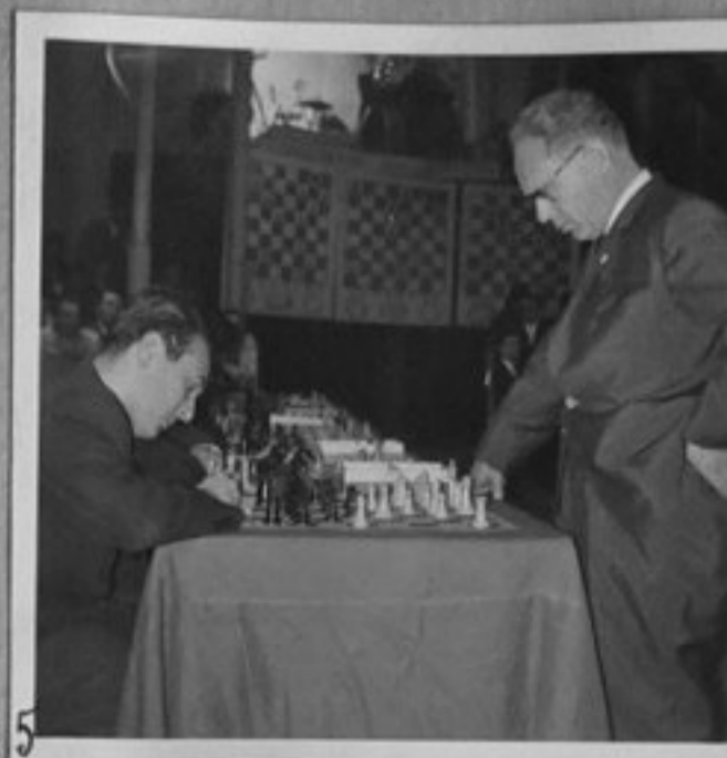
62/2946-1,5 - Моменти от срещата на световния шампион М. Ботвиник със столичните шахматисти. /Бурмов/ ММ