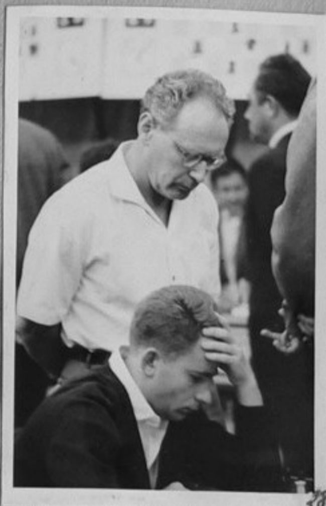
28-Спаски и Ботвиник.