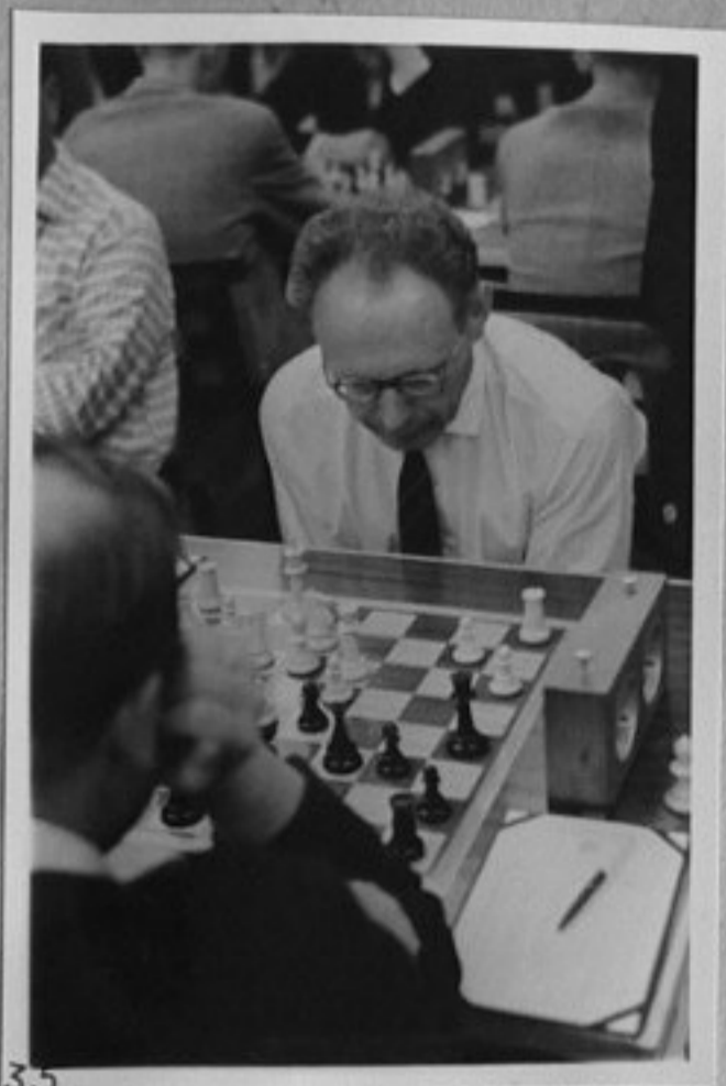
35- М. Ботвиник.