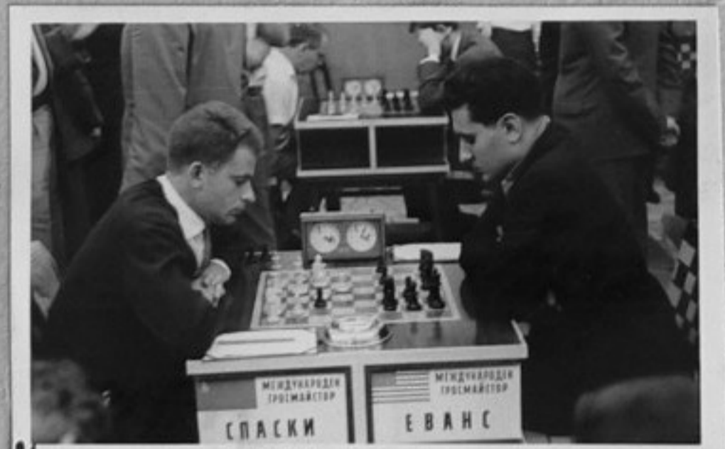
21-Както кадър 13.