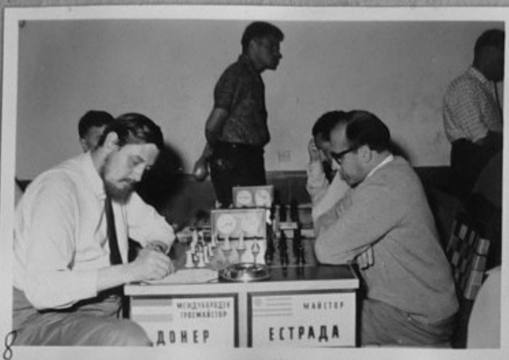
8 62/2752-8-мгс Донер /Холандия/ и Естрада /Уругвай/. /Томов/ ММ