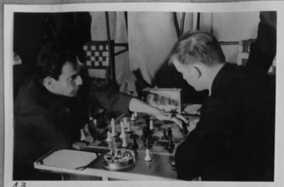
13 13-Тал/СССР/ - Звондерборг/Швеция/.