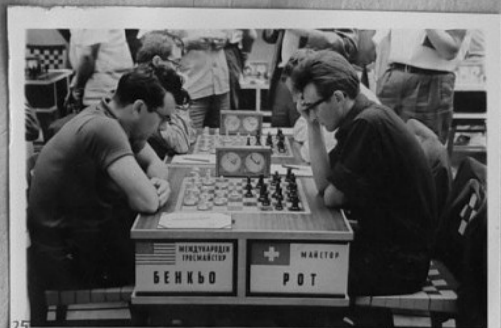
25-Бенкьо /САЩ/ - Рот /Швейцария/.