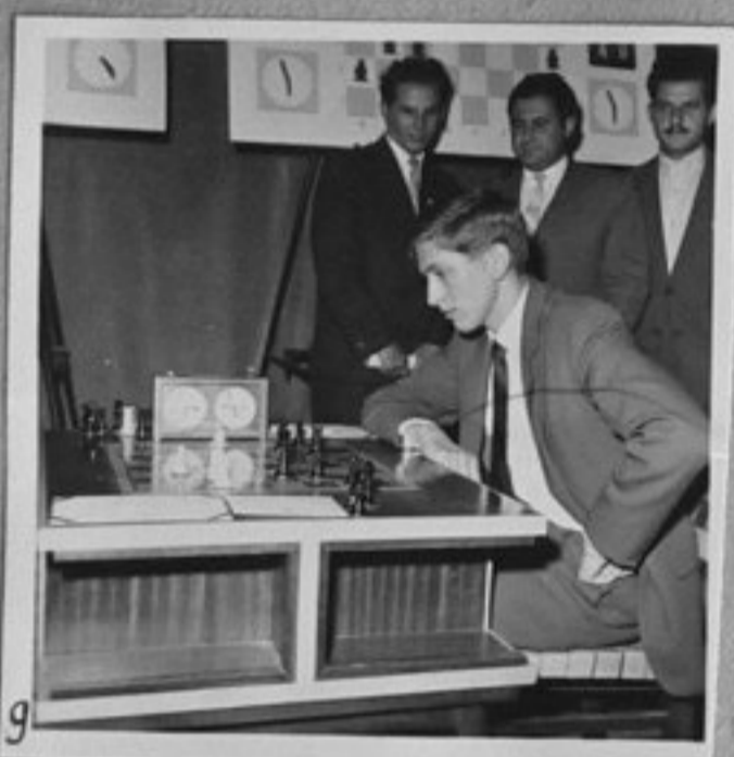
62/2938-9-Както кадър 8.