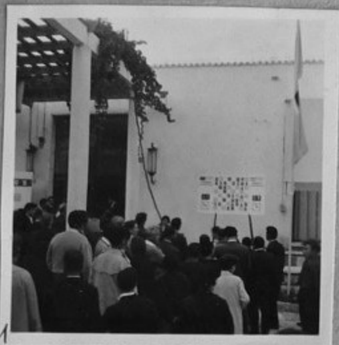
1-Таблото Ботвиник - Фишер пред казиното на "Златните писъци".