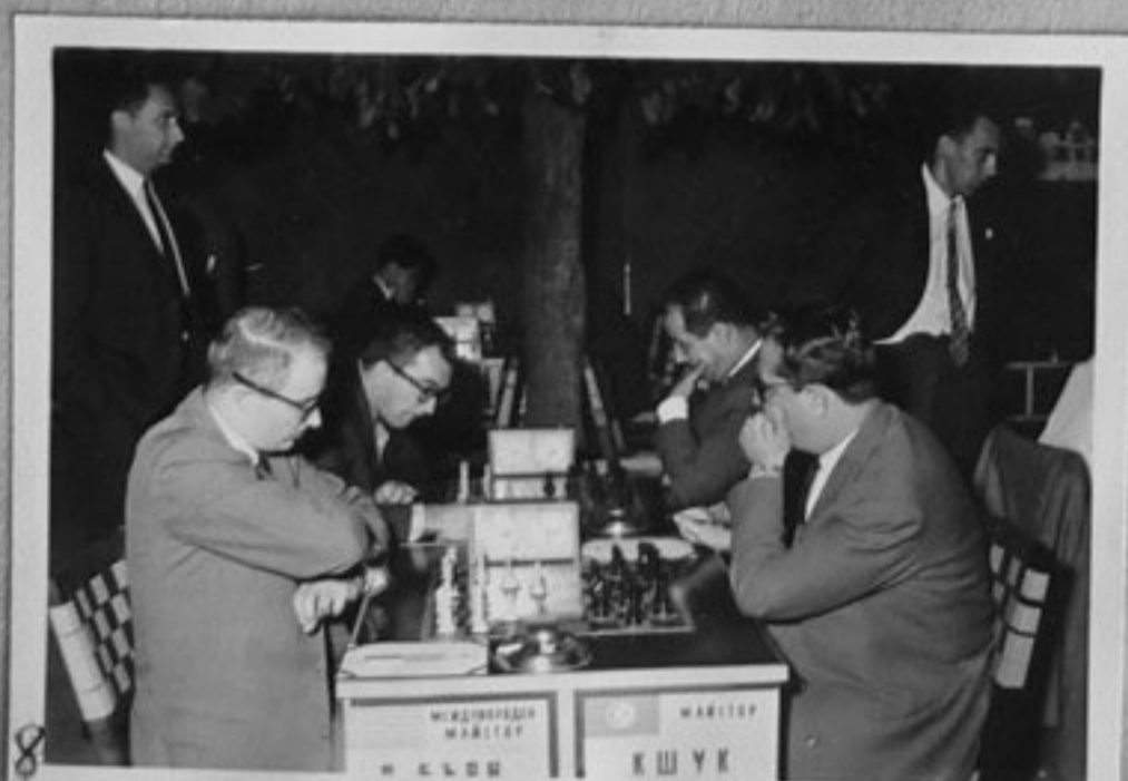
8 62/2753-8-ми Бери /САЩ/ и м Кшук /Тувис/. Томов/ММ