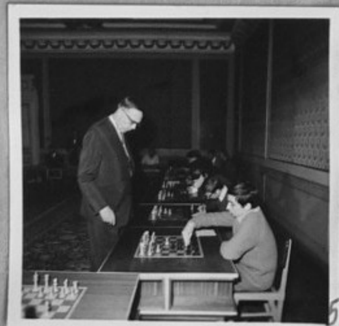
73-3912-1,3,4-Президентът на Международната шахматна федерация /ФИДЕ/ д-р Макс Еве се "сражава" с 20 български шахматисти.