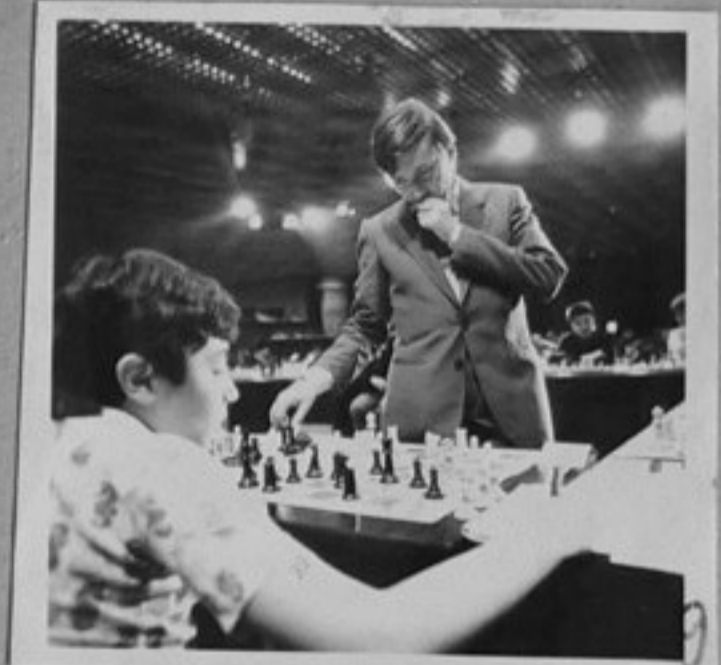
83-1311-1, 8, 9-Моменти от шахматния сеанс на световния шампион Анатолий Карпов.