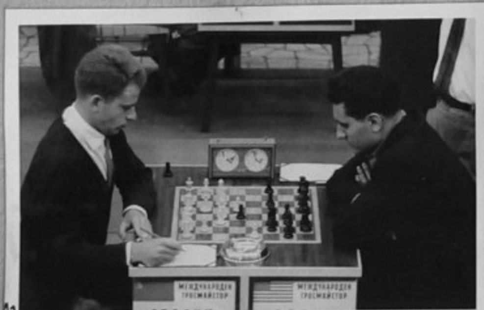
13 62/2936-13,18 - Спаски/СССР/ - Еванс/САЩ/. Парушев/ММ