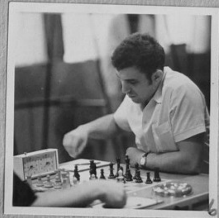
72-4462-2,5,6-Моменти от IV балкански игри по шахмат.