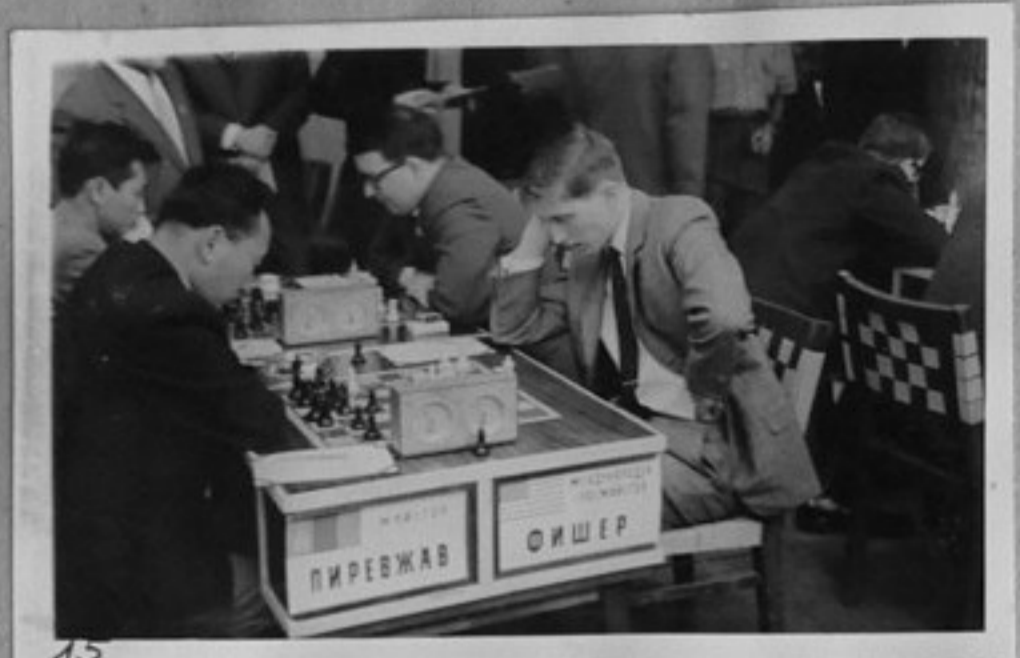
15- Пиревжав/Монголиа/-Фисер /САЦ/.