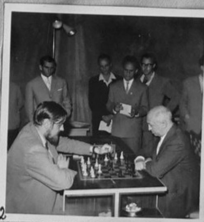
2-Донер /Хол./-Найдорф /Аржентина/.