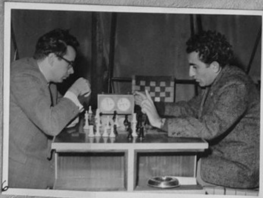
62/2939-6-Петросян/СССР/- Бенкьо /САЩ/. Парушев/ММ