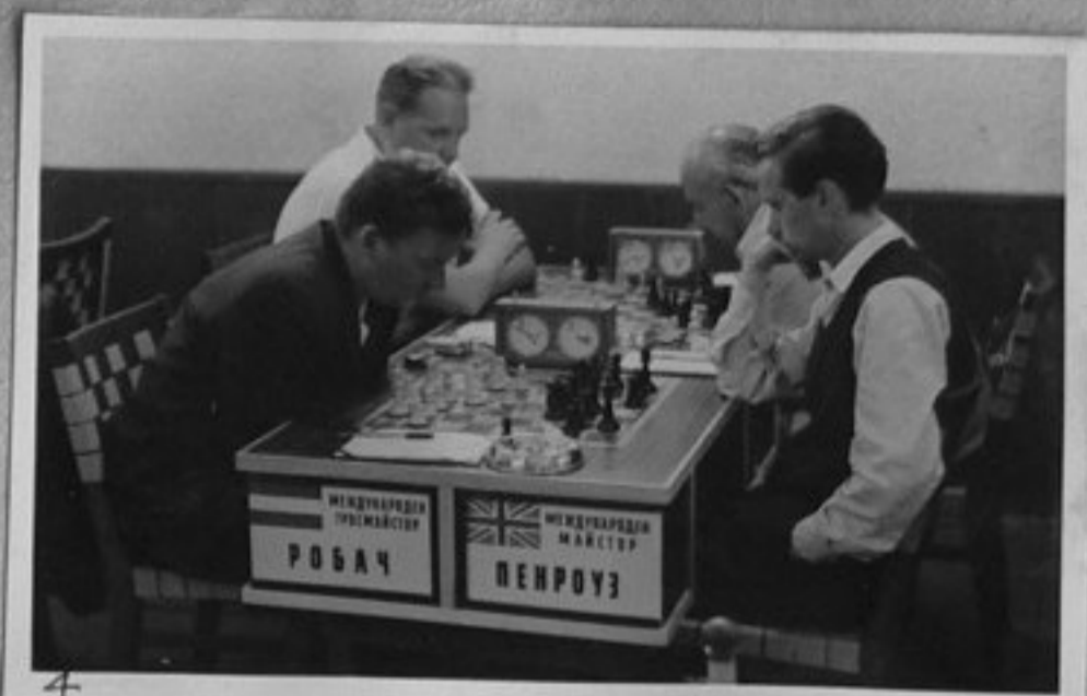
4 62/2746-4-Робач /Австрия/-Пен роуз /Англия/. /Парушев/ ММ