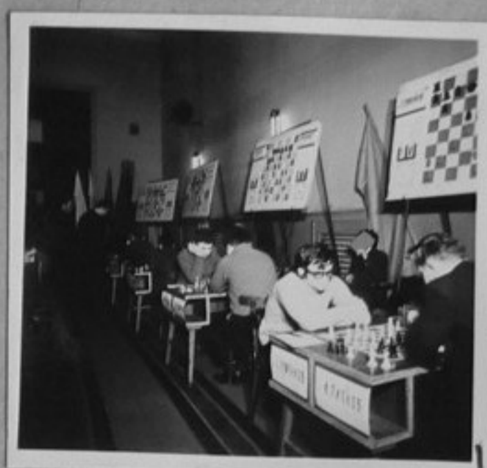
Републикански шампионат по шах. /Л. Георгиева/ ИК 71-418-3-М.с. Киров.