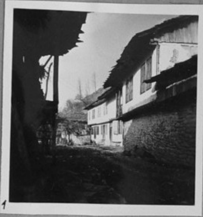
1 - Стари къщи из с. Орешака - Троянско.