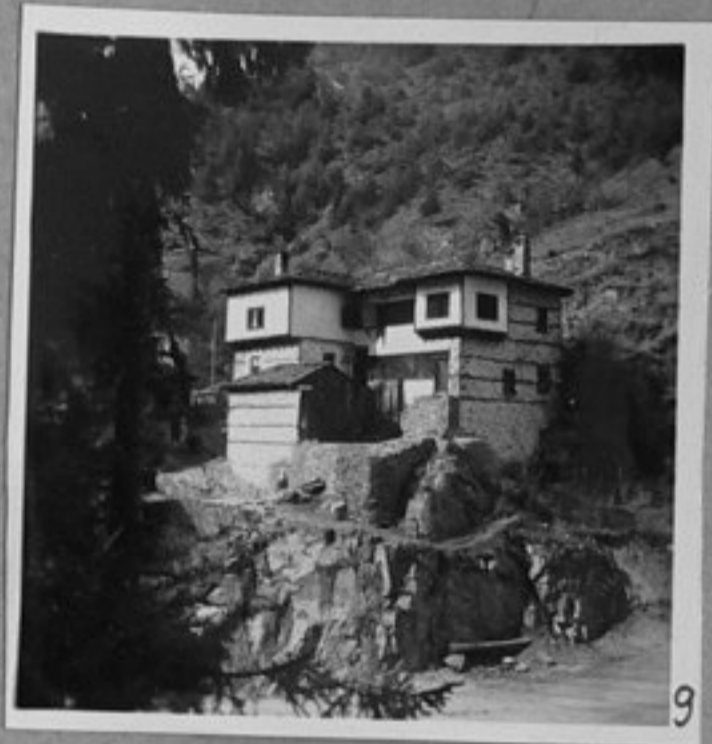
9 - Родопска архитектура от миналия век. Згуревската къща в с.Широка Лъка.