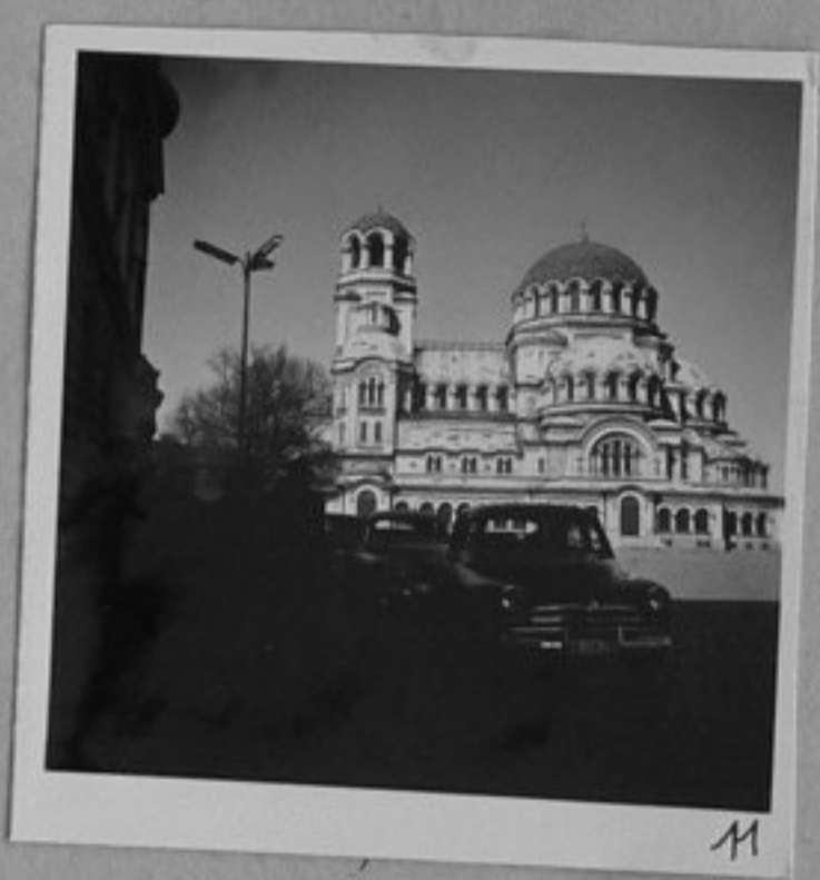
11 - Храм-паметник "Александър Невски".