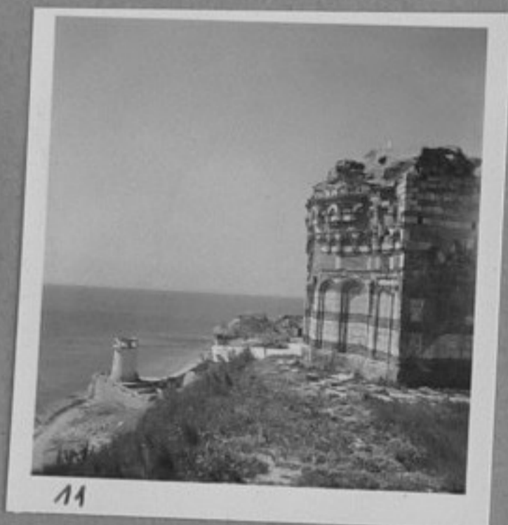
11 - Новата митрополия строена в XVI век.