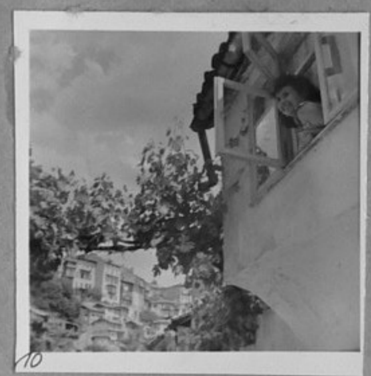
10 - Из Търново.