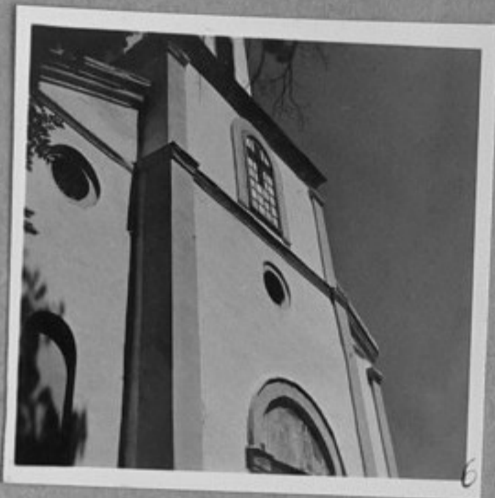
6 - Църквата св. Богородица.