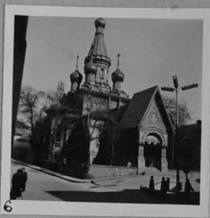
6 - Руската черква на бул. "Руски".