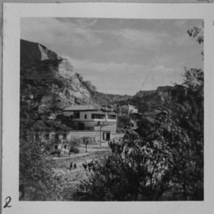
2 - Къща-музей на Ибраим Бег, а сега наречена "Пашовата"