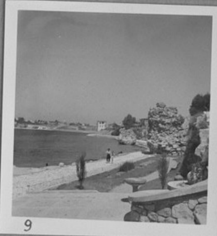
9 - Старата стена на крайбрежната улица.