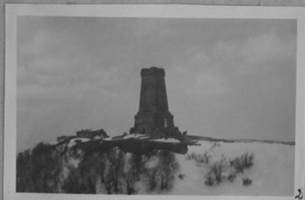
2- Паметникът на връх "Столетов" - зима.