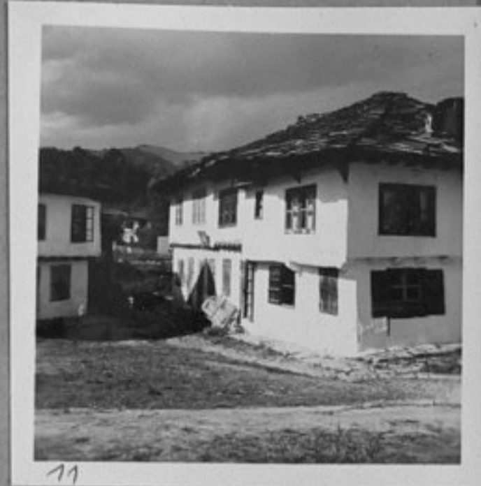
11 - Стара архитектура в с. Ново село - Троянско.