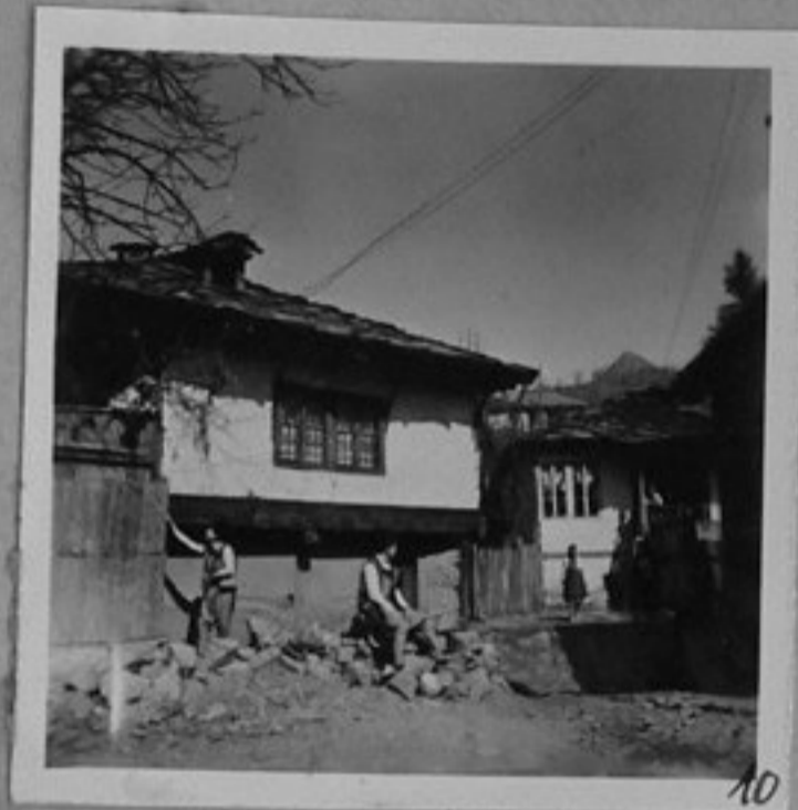
10 - Старинни къщи в град Тетевен.