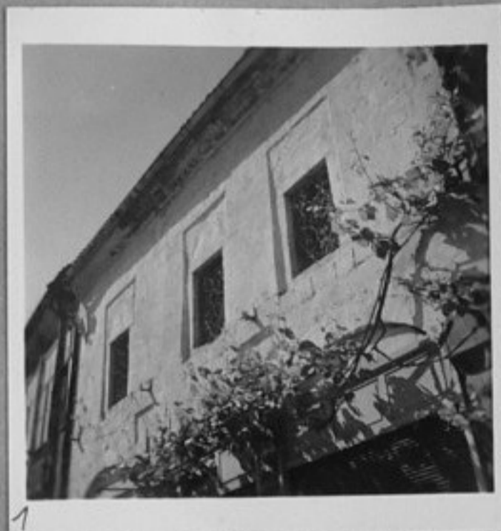
1 - Из Търново