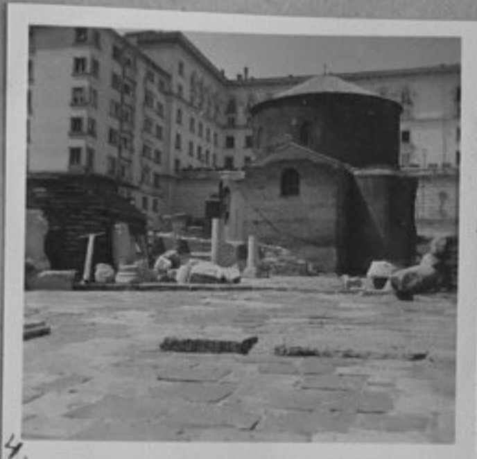
4-Старинната черква "Кв.Георги".