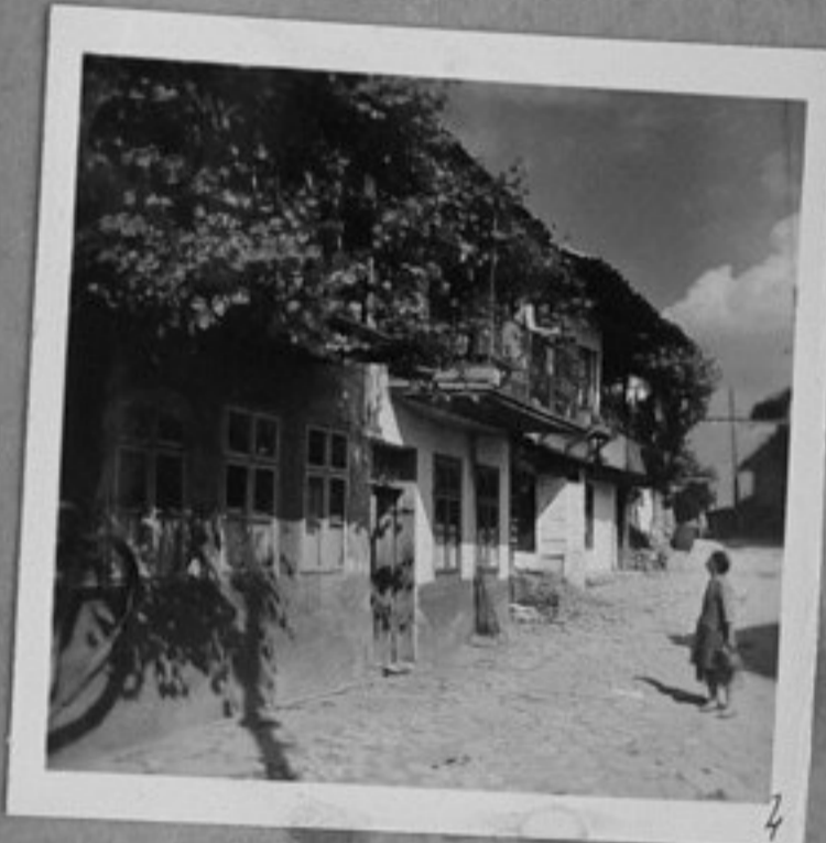
4 - Из Търново