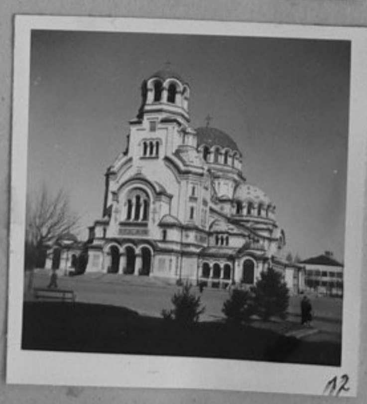
12 - Също като № 11.