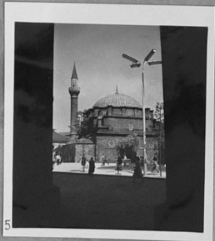
5 - Джамията.