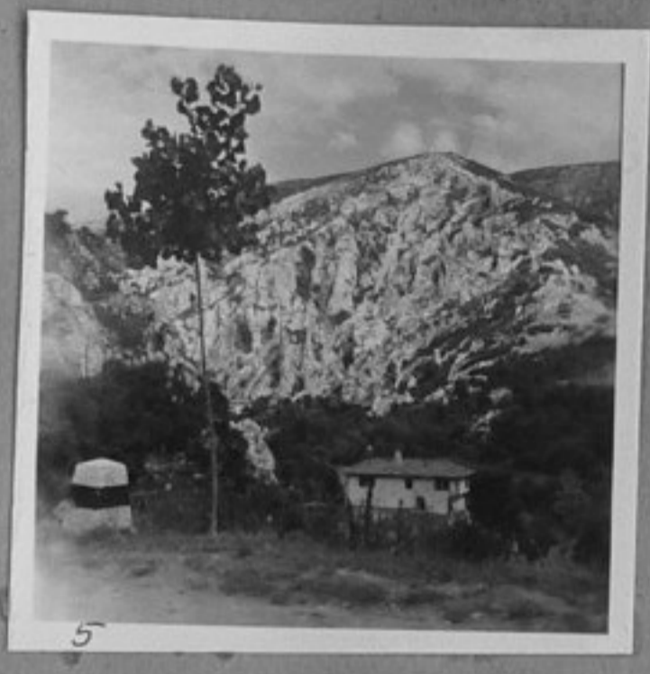
5 - Манастира.