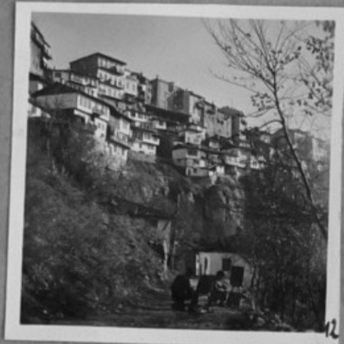
12- Кът от гр. Търново.