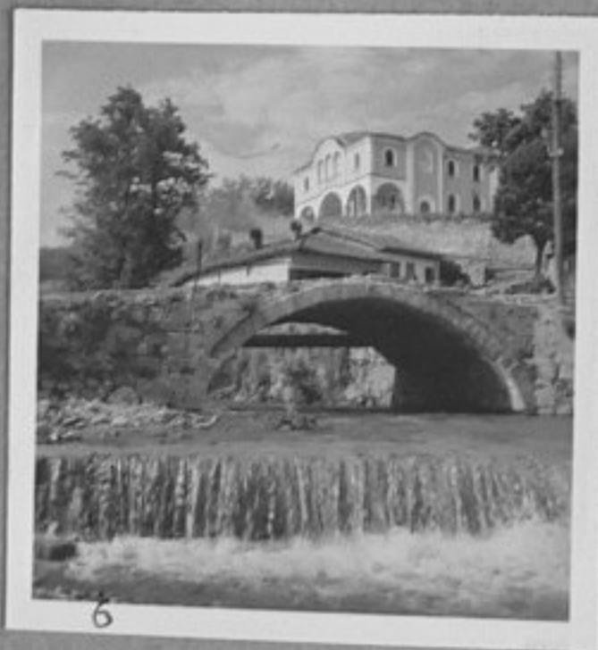
6-Изглед от Калофер.

Handwritten mark resembling a stylized '9' or a signature.