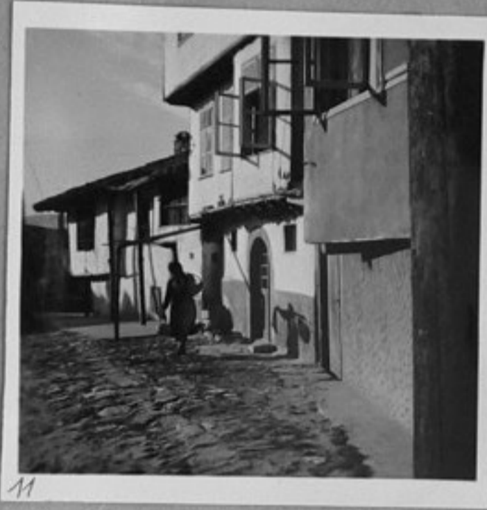
11 - Из Търново