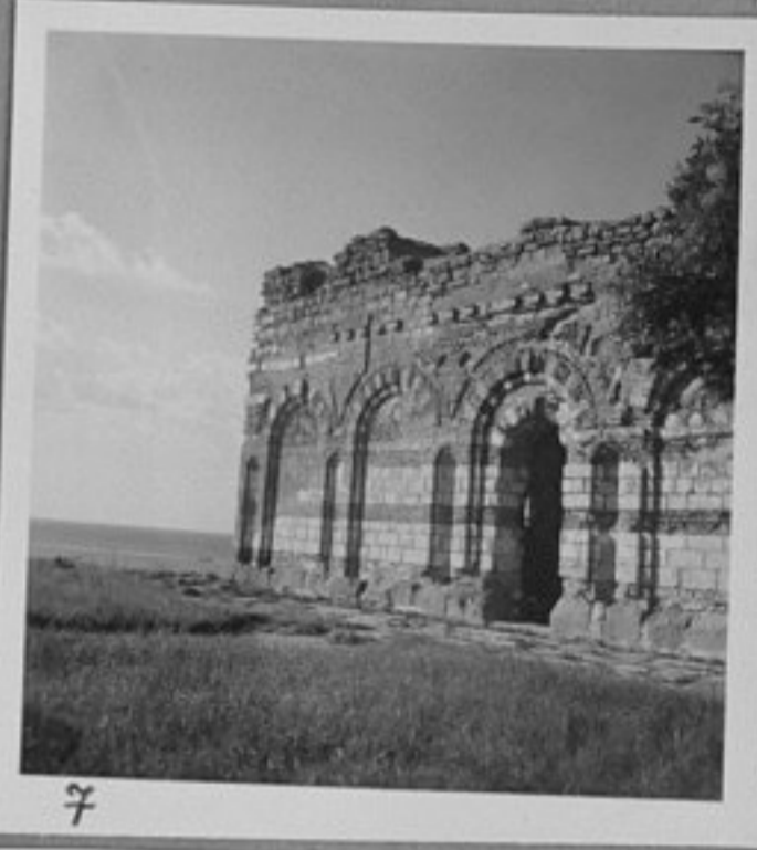
7 - Новата митрополия строена в XVI в.