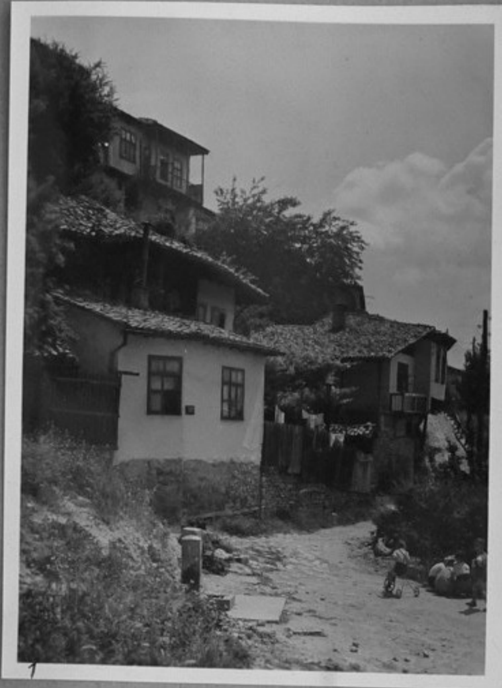
1 - Из Търново.