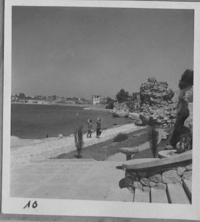
10 - Също като № 9.