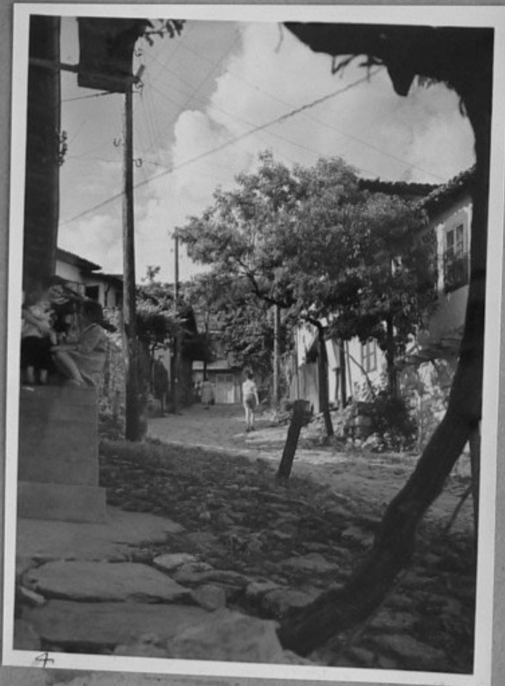
4 - Из Търново