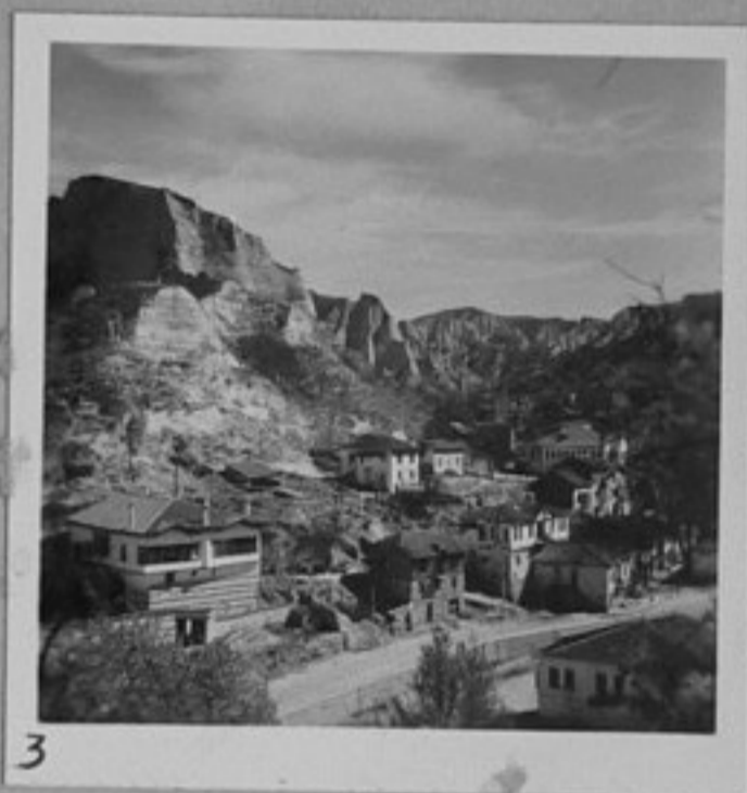
3 - Също като № 2.