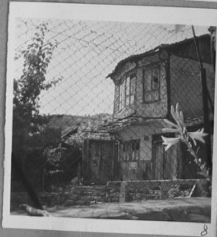
8 - Из Търново