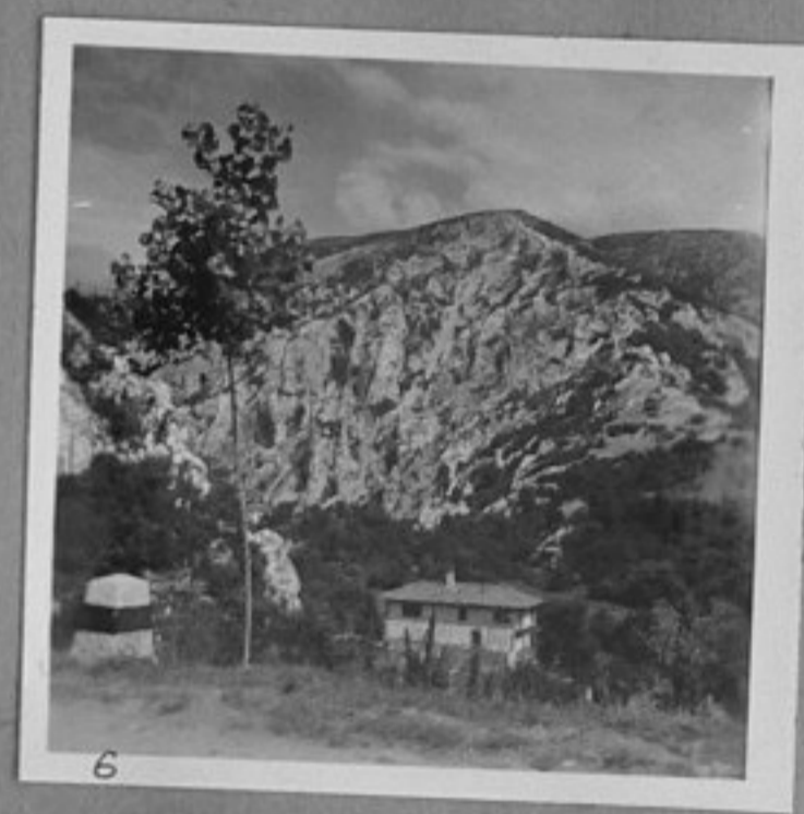
6 - Манастира

Handwritten scribbles and lines, possibly a signature or initials.