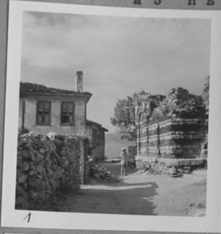
1 - Стара улица в Несебър.