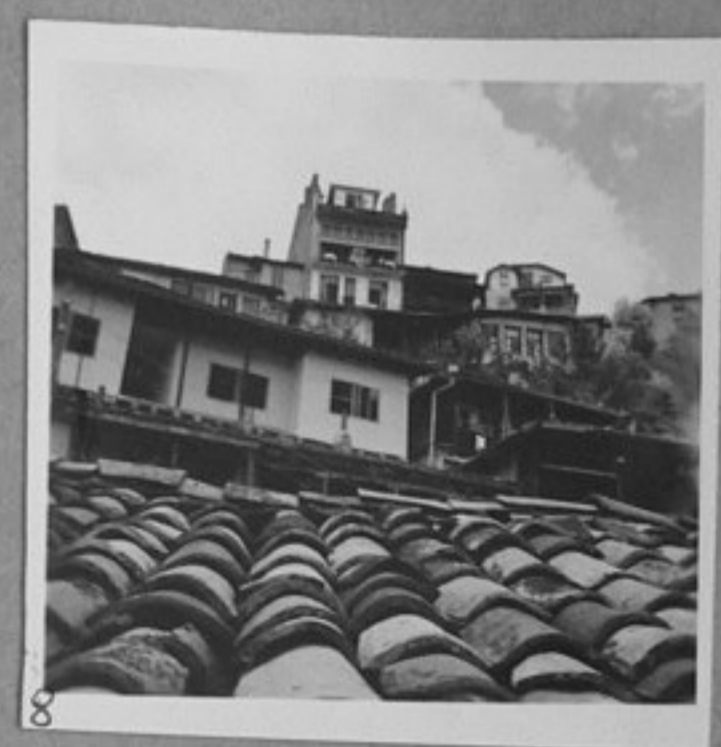
8 - Из Търново