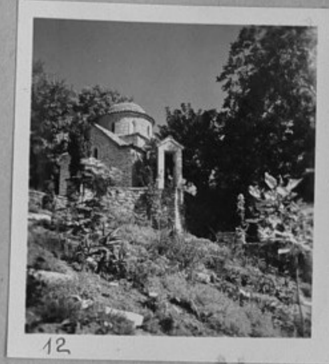
12 - Църквата при двореца.