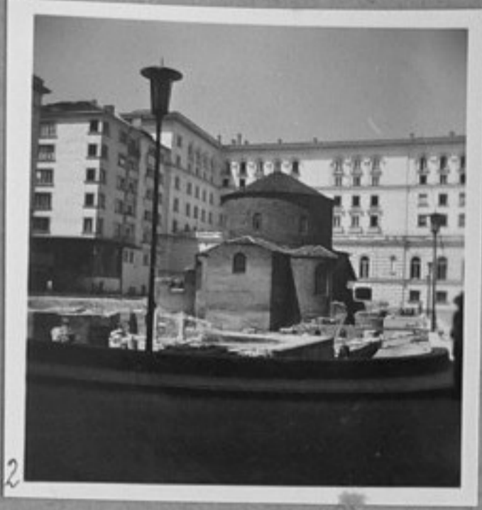
2 - Черквата Св. Георги - в двора на Министерството на Електрификацията.