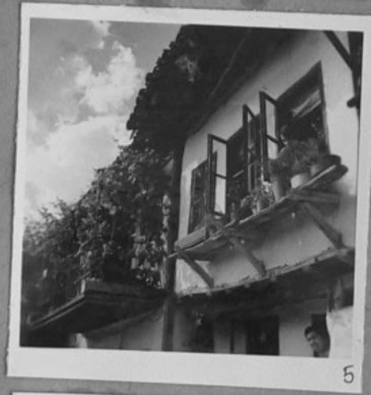
5 - Из Търново