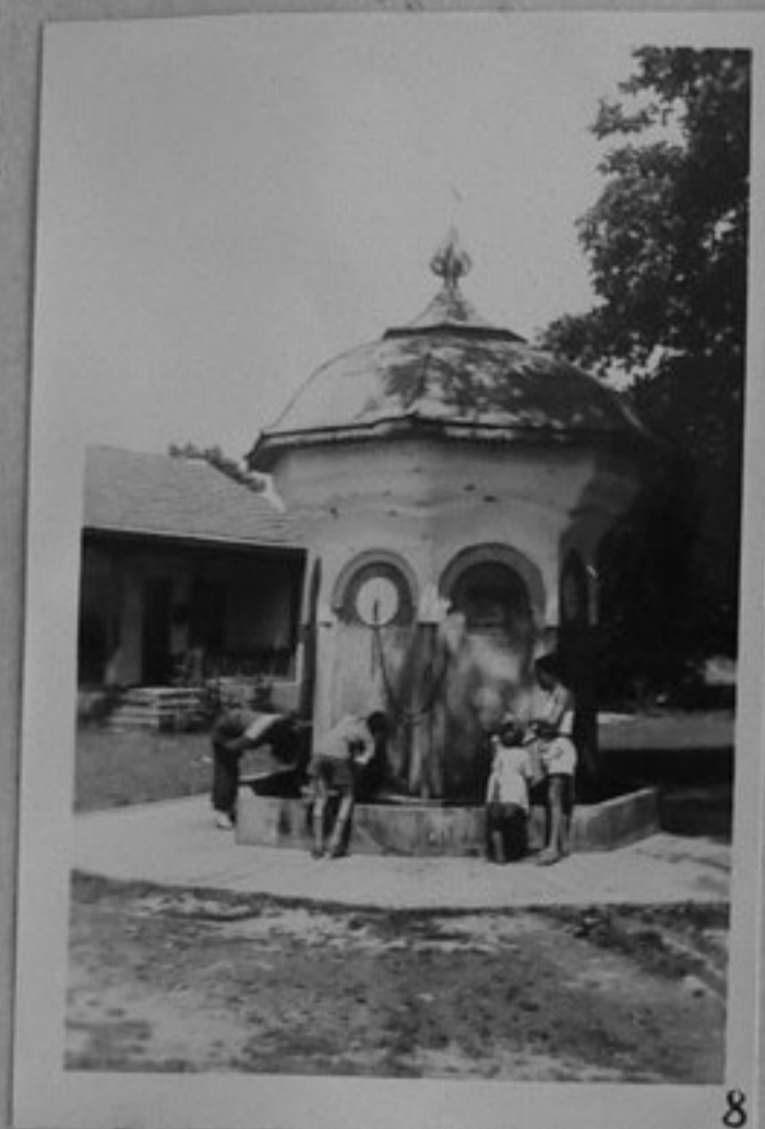
8- Чешмата на Габровския /Соколски/ манастир, строена през 1868 г. от уста Колю Фичето.