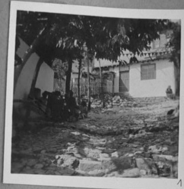
1 - Из Търново