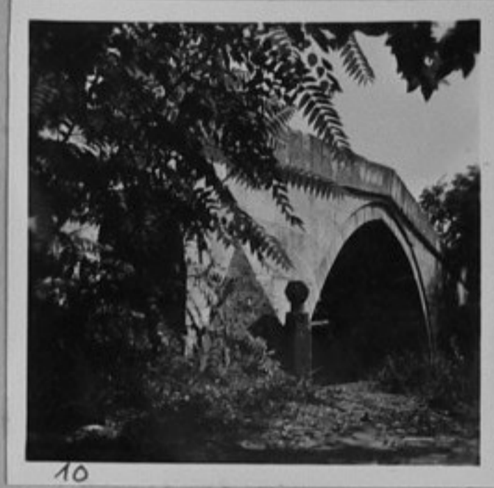
10 - Старинен турски мост в град Харманли.