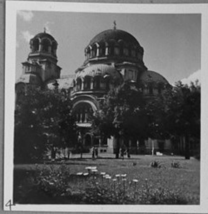
4 - Александър Невски.