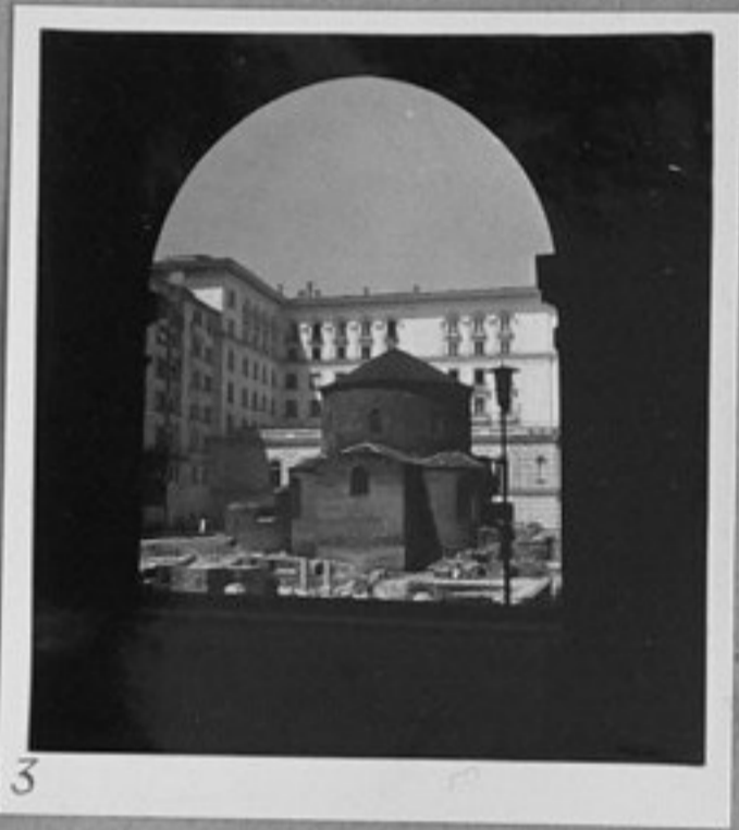
3 - Също като 2.