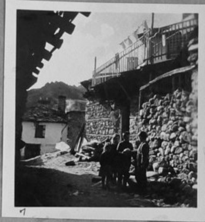
1 - Из старите улички на гр. Смолян.