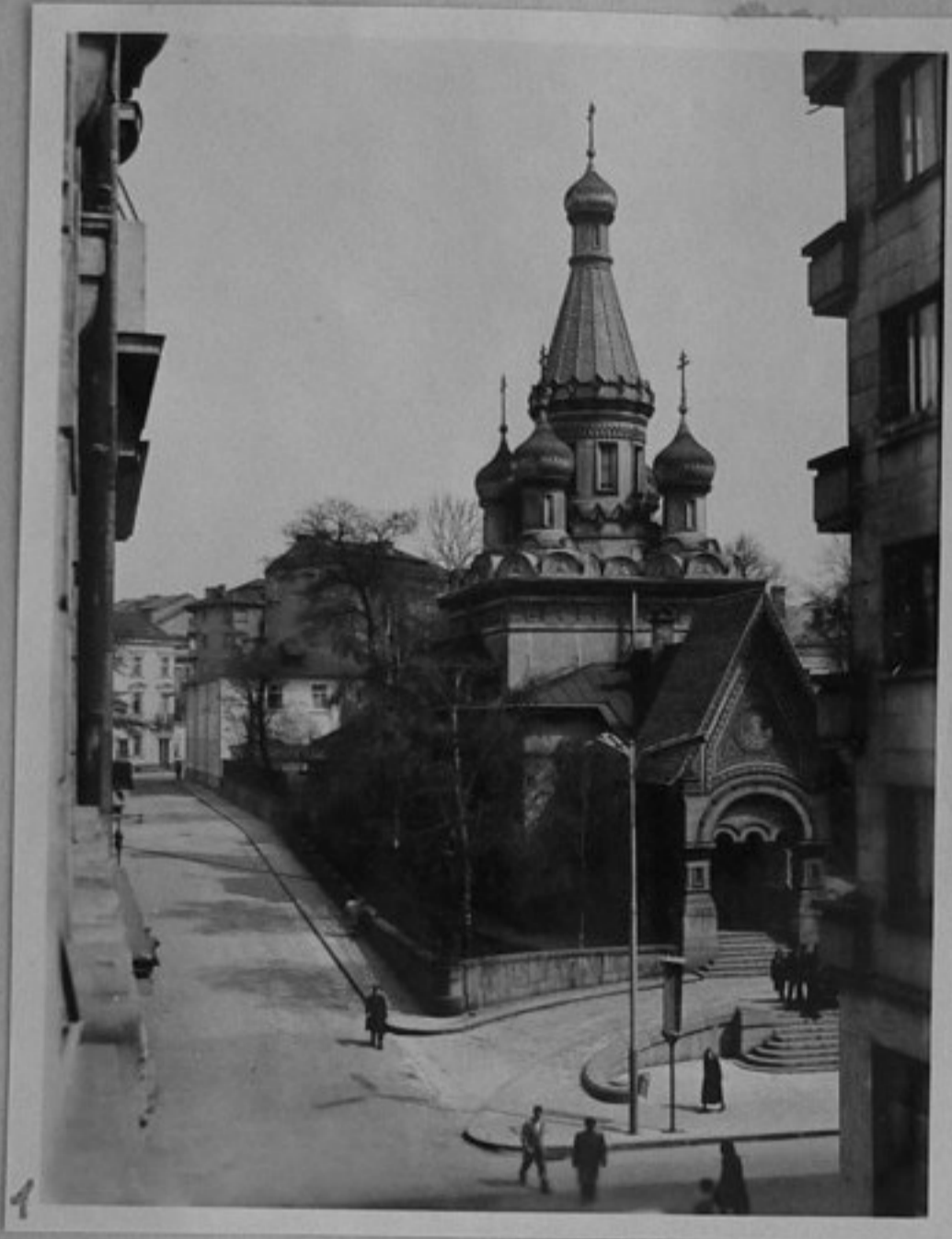
1 - Храм паметник "Руската църква".