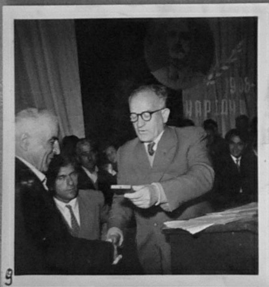
9 62/1255-9-Както кадър 7.