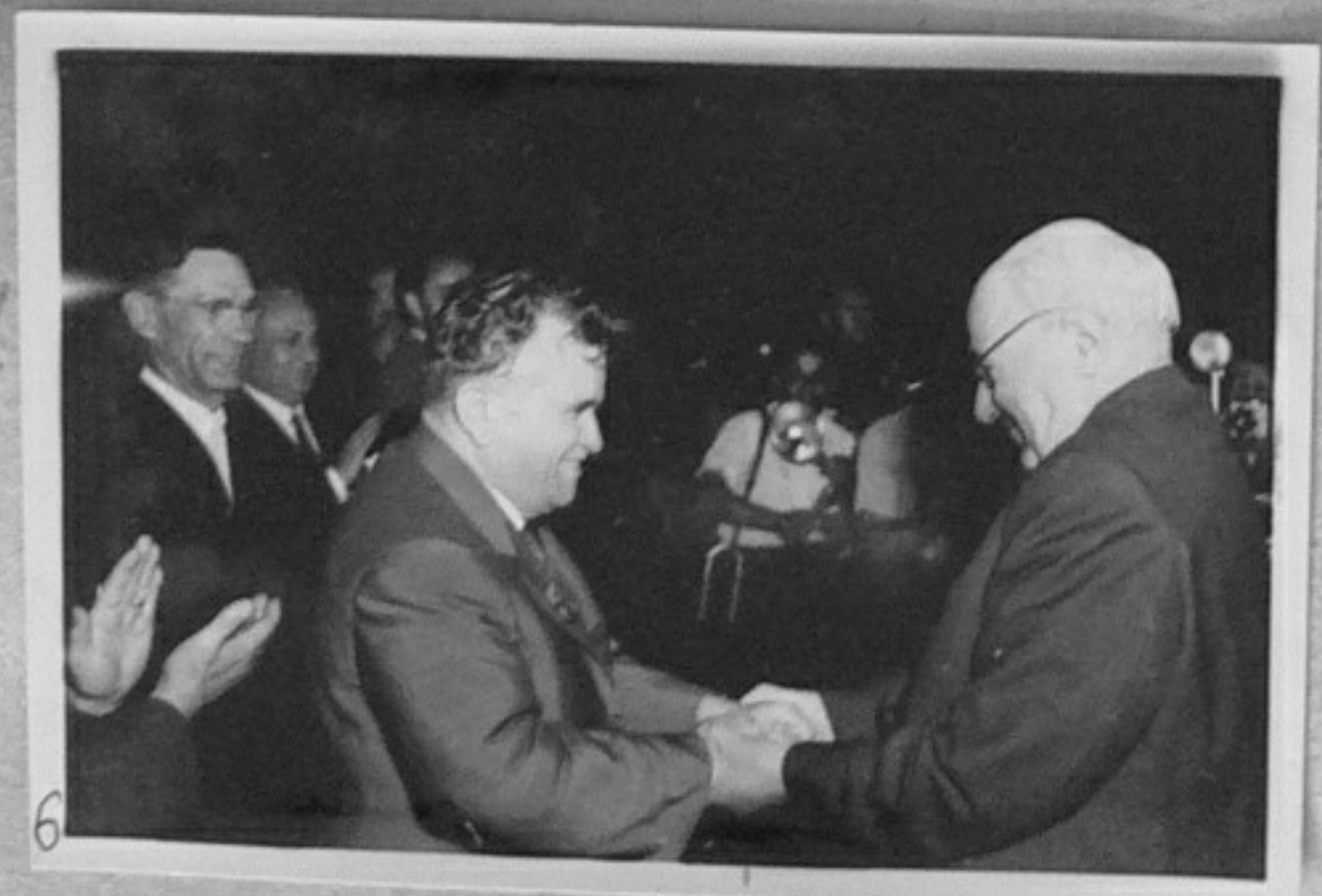
63/1948-6 - Както кадър 3.