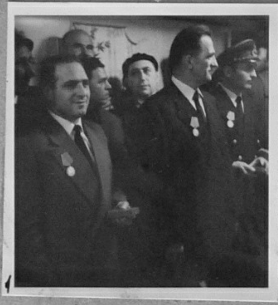
64/670-1-Тържествено награждаване на екипажа от кораба "Г.С.Раковски" възвръщил отколесетско плаване /Парушев/ ММ