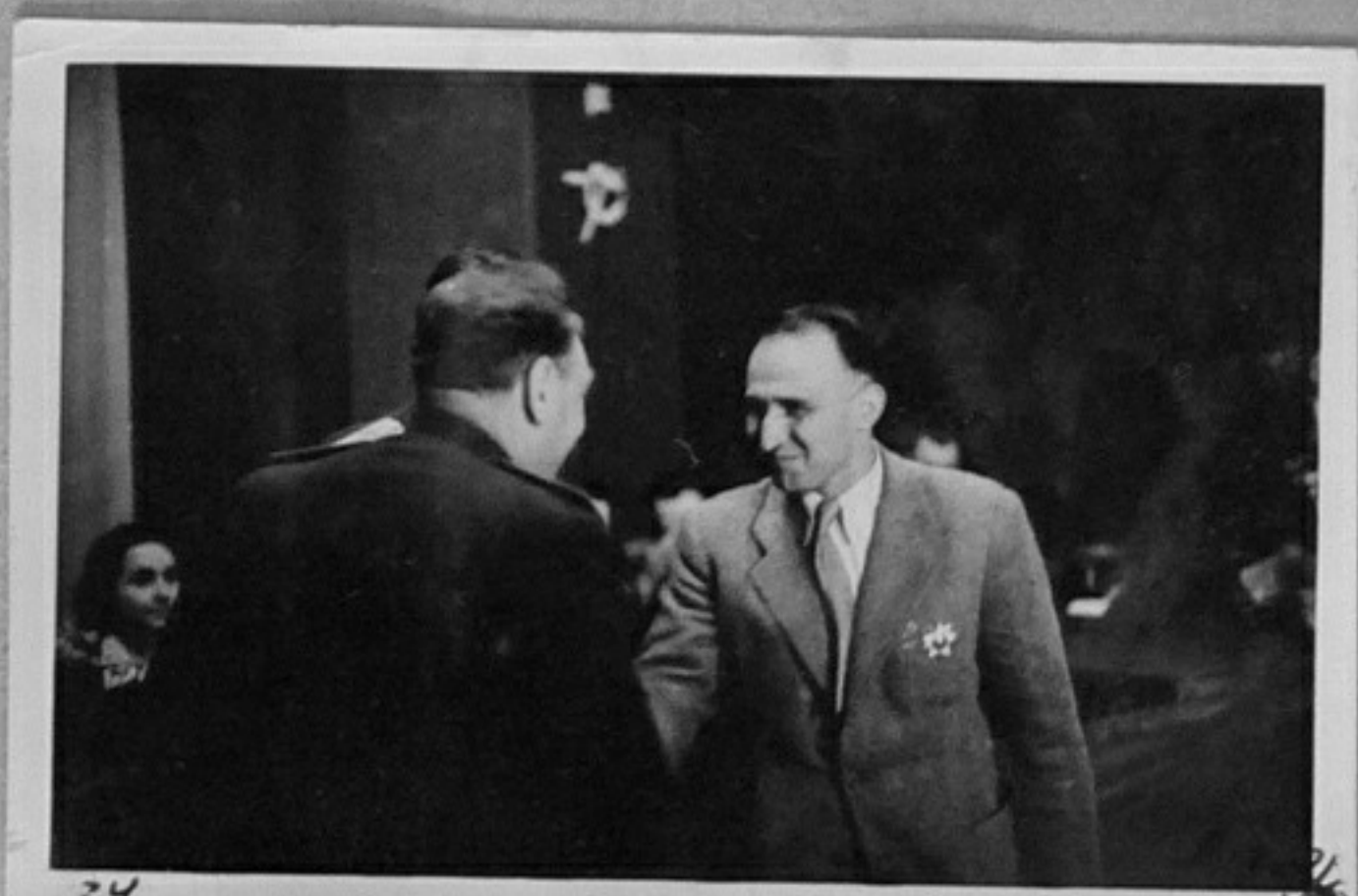
25- Награждаване на български партизани от ген. Биръзов. В дясно, Т. Живков.