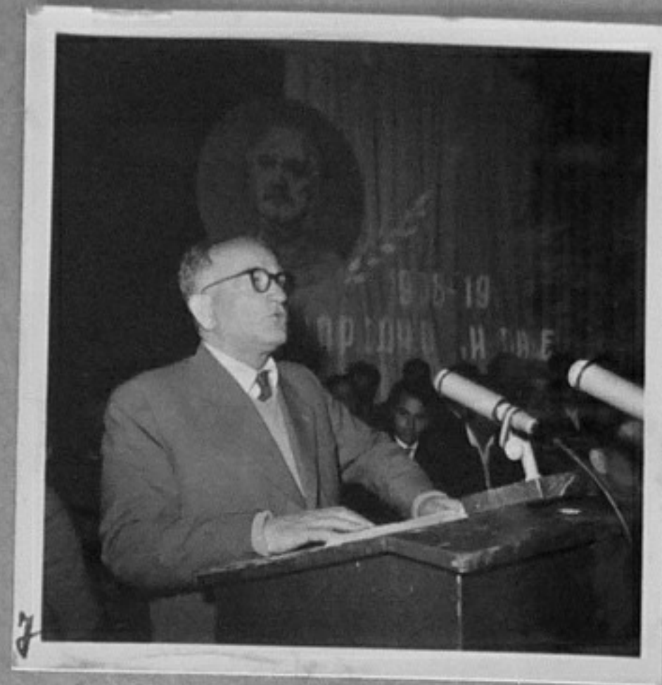
62/1255-7-Награждаване читалището и читалищните дейци в с. Белица, Разложко. ММ 62-1255-7