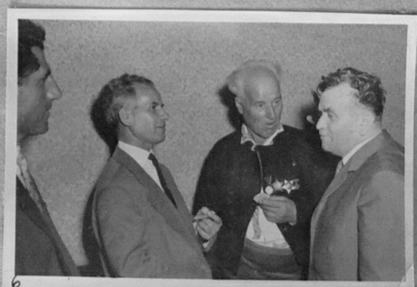
6 63/1953-6 - Тържествено събрание по случай връчването на международната Ленинска награда