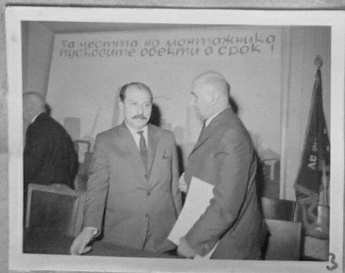
69-3411-3-Връчване на Юбилейното знаме на МС и Центр.съвет на профсъюзите на ДО "Монтажи". - Др.Пенчо Кубадински и директорът на ДО "Монтажи". XII