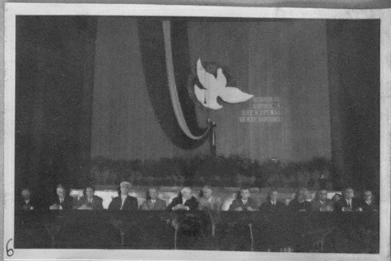
2 63/1949-2,6 - Тържествено събрание по случай връчването на международната Ленинска награда "За укрепване мира между народите" на д-р. Георги Трайков. ИИ