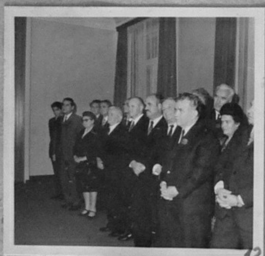
Др. Тодор Живков - награден със златния медал "Фредерик Жолио-Кюри". 73-4282-2-Момент преди връчването на наградата. 73-4282-5-Ромеш Чандра, ген.секретар на Световния съвет за мир, връчва високата награда на др. Т.Живков. 73-4282-9-Др.Т.Живков благодари за високата награда.