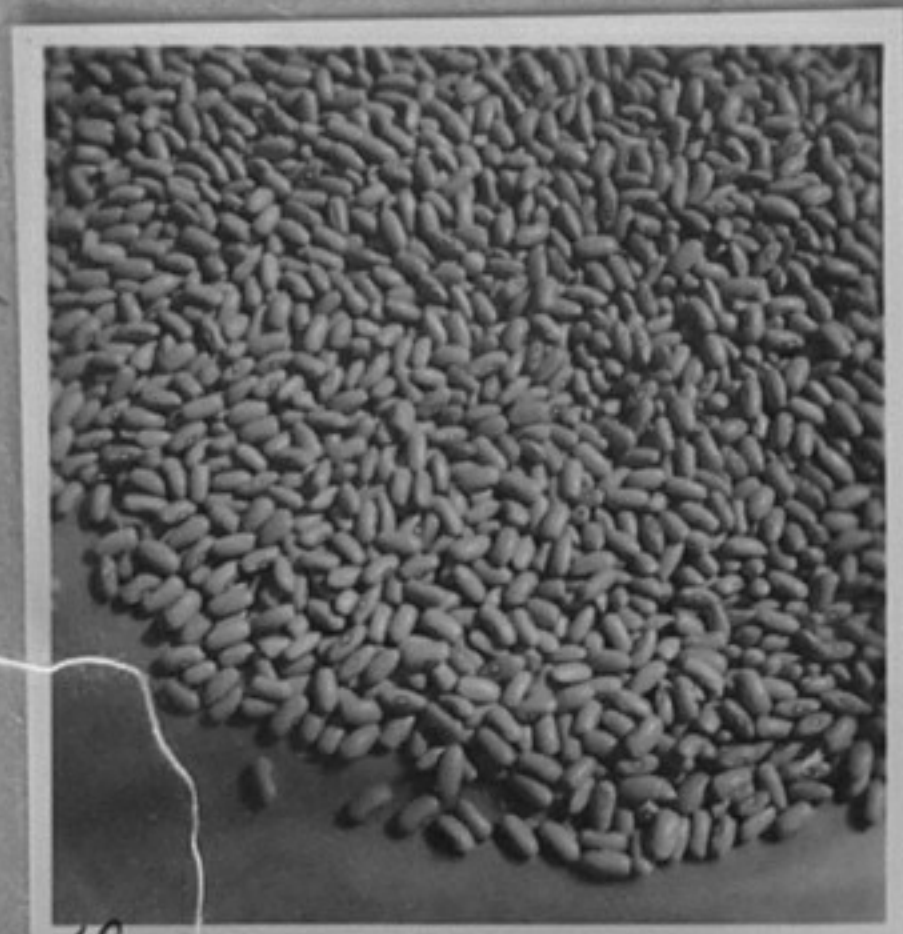
63/2438-10—Семена от фасул "Сакса". /Чаръкчиев/ ММ