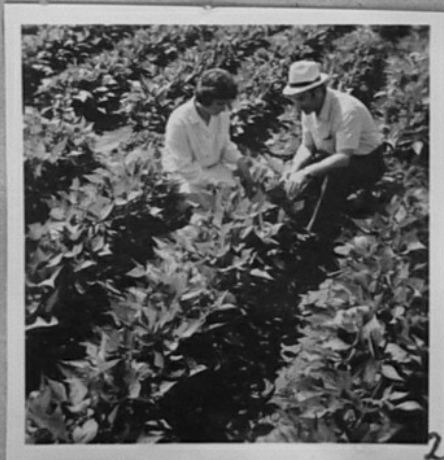
73-3812-2-Насаждения от градински фасул - Инсти- тут по зеленчукопроизвод- ство "Марица" край Плов- див.