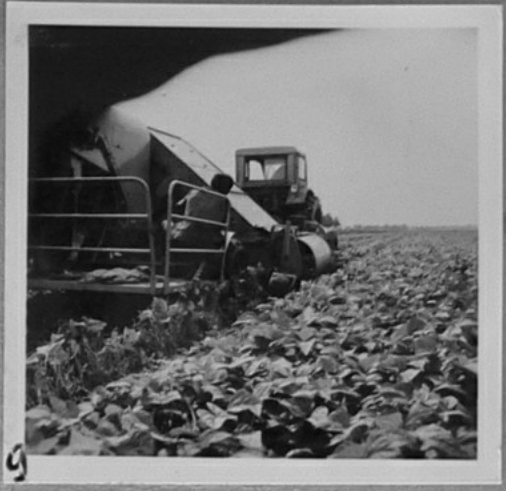
66/2021-3,7,9 - Събиране на боб с бобов комбайн в д. Бре гове, Видински окръг. /Ускеселчев/ ЕИ