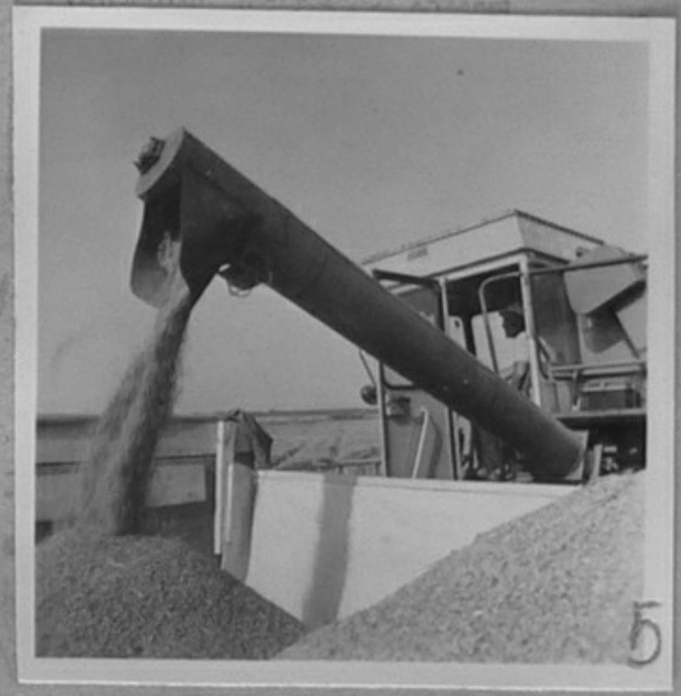
84-1323-5 АПК "Мало Конаре" - жътва на ориз