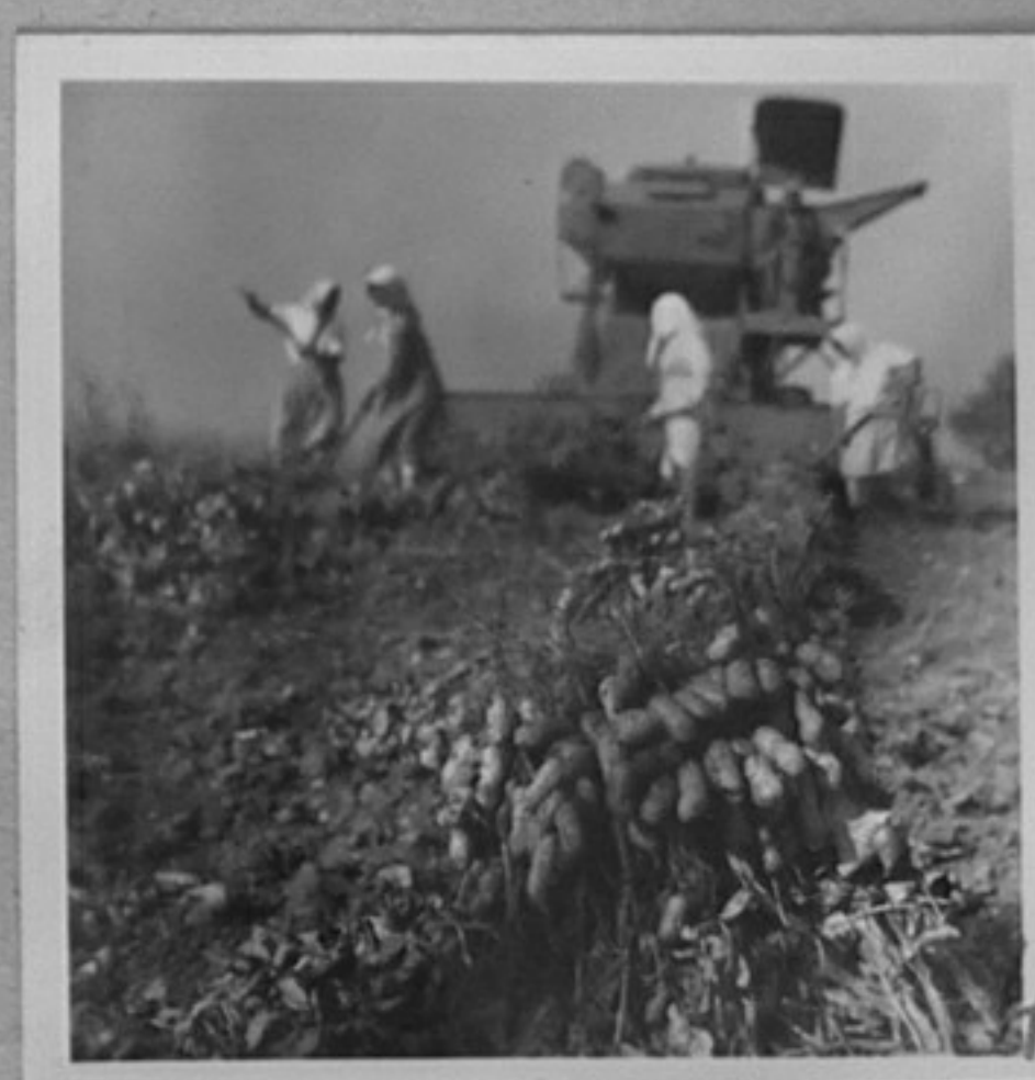
84-1324-1, 2, 4 Беритба на фъстъци в АПК - град Садово