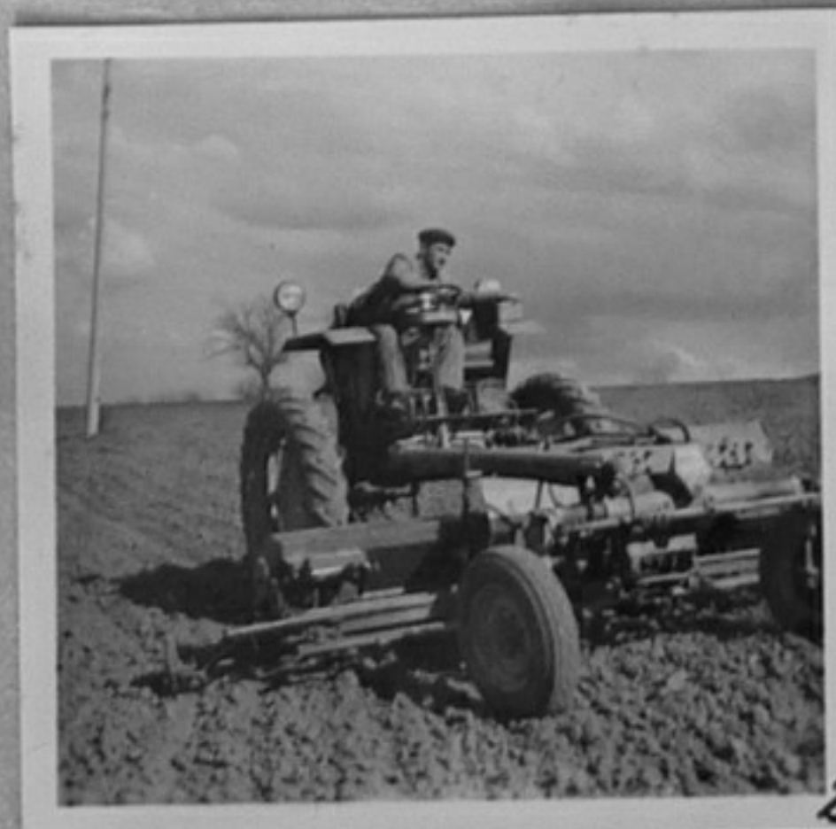
69-1484-2-с.Михалци окръг сеитба на фасул.