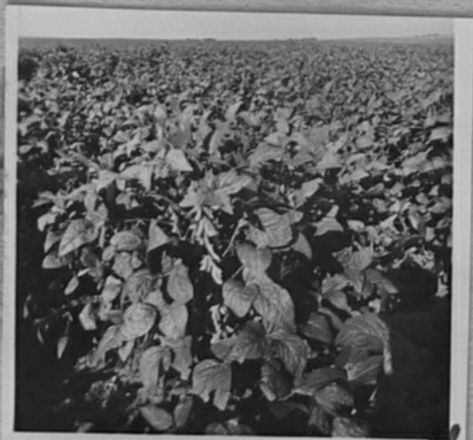
80-2597-11-Масив със соя.