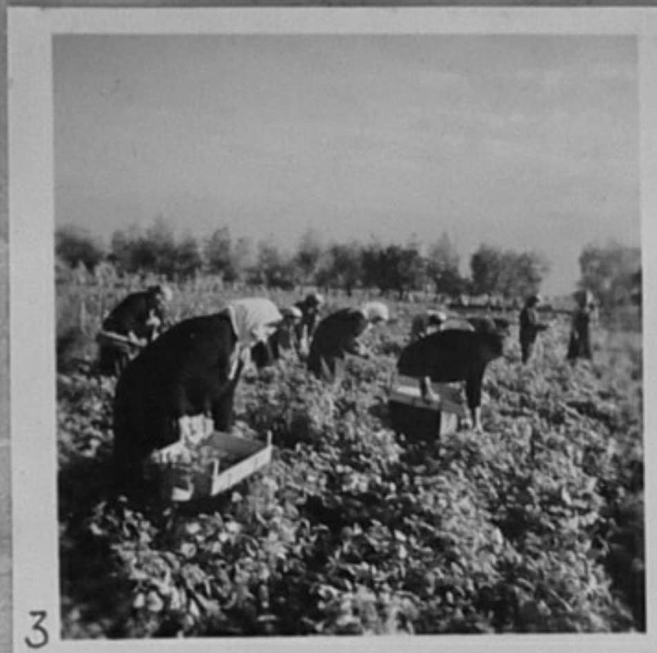
58/3661-3-Бране на фасул в ТКЗС с. Малашевци. ММ