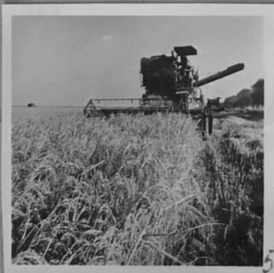
80-3223-8,10,12-Жътва на ориз в АПК "Съединение", гр. Съединение.