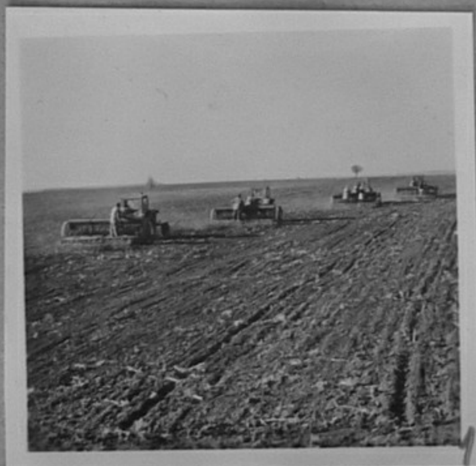
72-1450-1-Сеитба на грах - с. Суворово, Варненско.