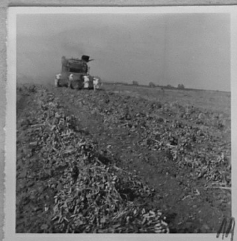
84-1324-9, 11 Беритба на фъстъци в АПК - град Садово