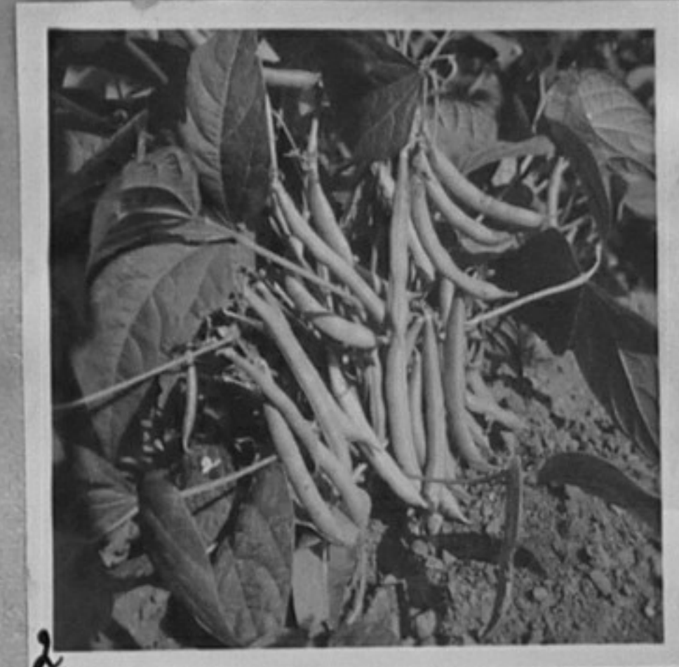
63/2195-2-Фасул "Консерва 2", Търновско. /Чаръкчиев/ ММ