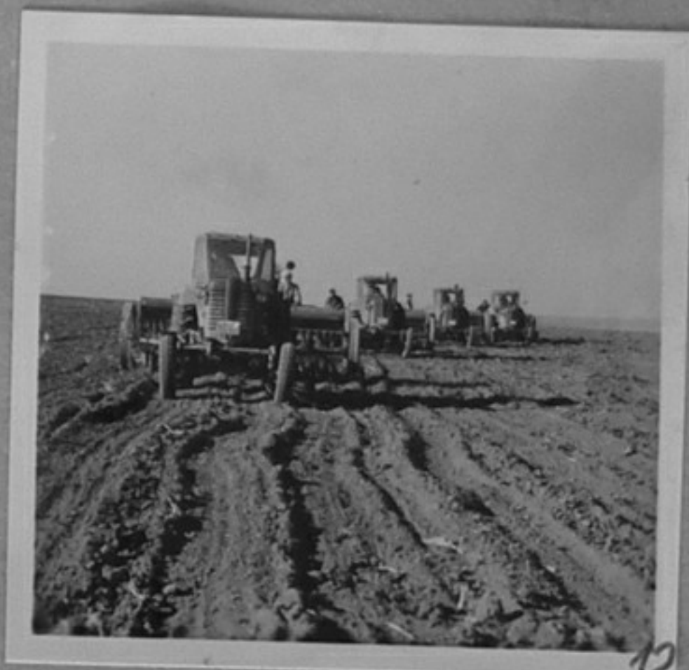
72-1449-1,3,12-Сеитба на грах - ТКЗС Суворово, Варненско.