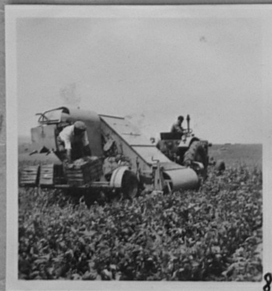
68-3571-8-Беритба на зелен фасул в с.Калугерово, В.Търновски. Механизирана Хасковски окръг. ХП