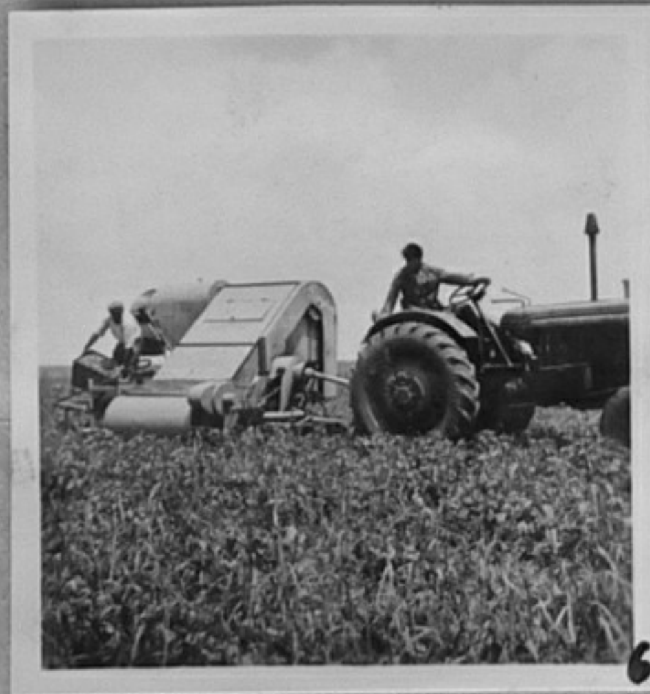
68-3571-6,7-Механизирана беритба на зелен фасул в с.Калугерово, Хасковски окръг.