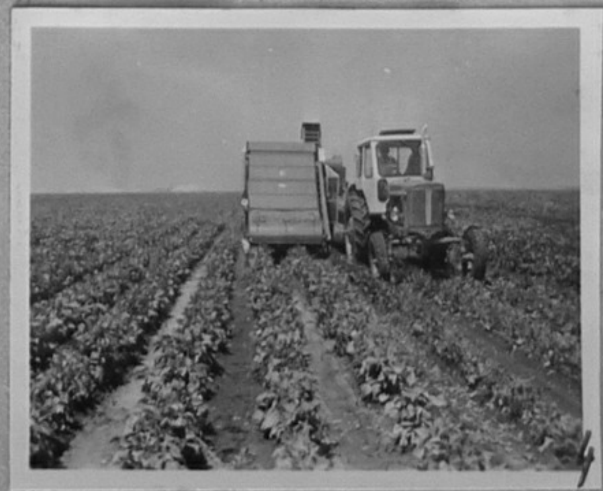
74-3842-4-Механизирано прибиране на фасул, с.Голям Чардак, Пловдивски окръг.