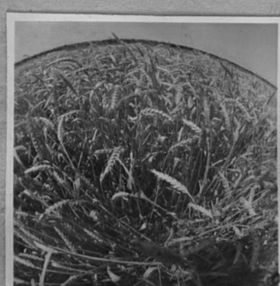
84-896-5-Механизирано събиране 84-896-6,8-Блок пшеница. /В.Балевска/ЛА на слама. /В.Балевска/ЛА