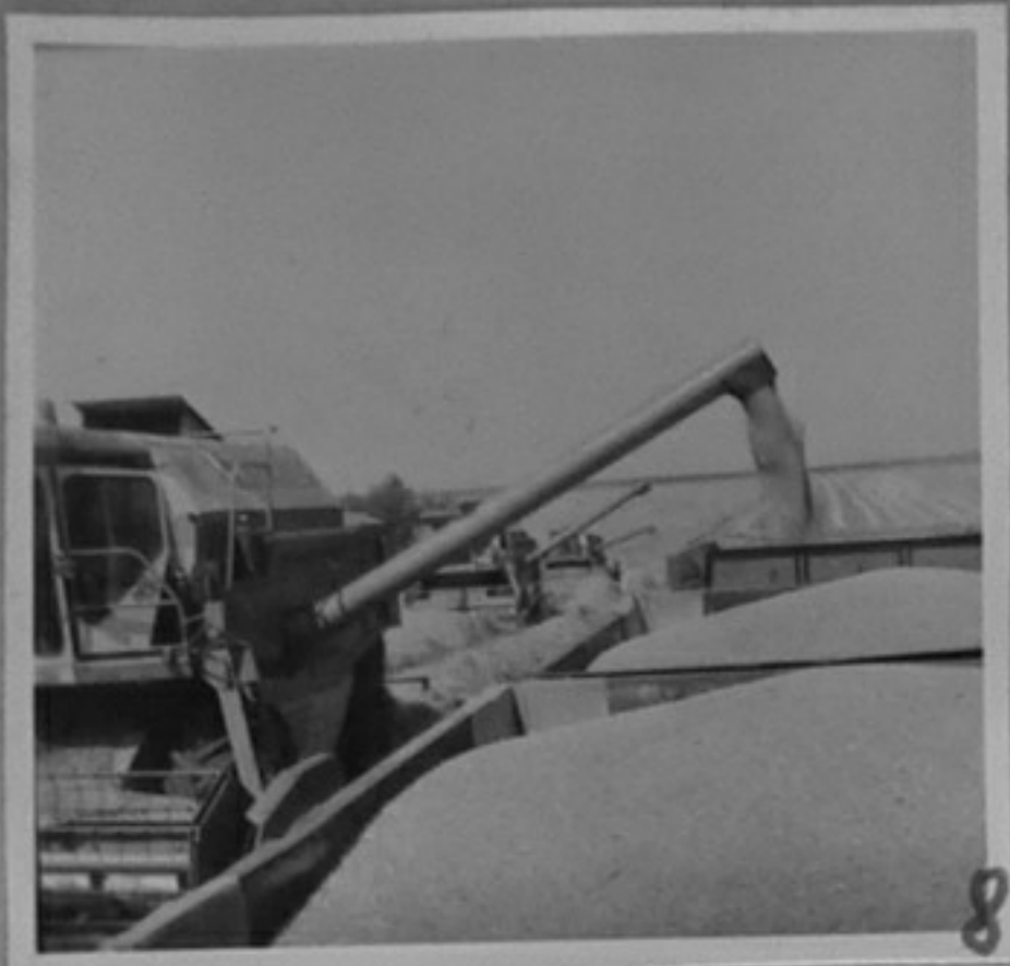
84-914-8-Жътва в АПК "Г.Димитров"- Ямбол.