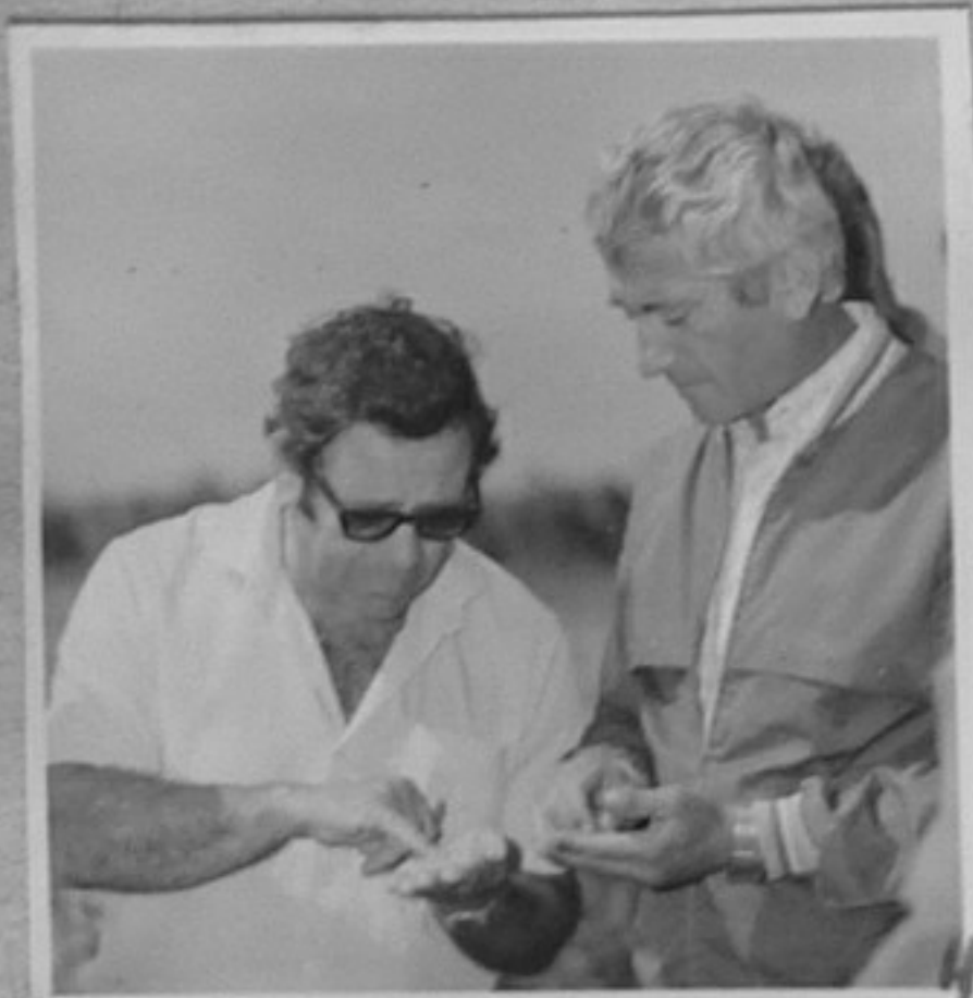
84-849-4,8-Жътва в АПК гр.Съединение./В.Балевска/ЛА 84-852-2-Жътва в АПК гр.Съединение В.Балевска/ЛА