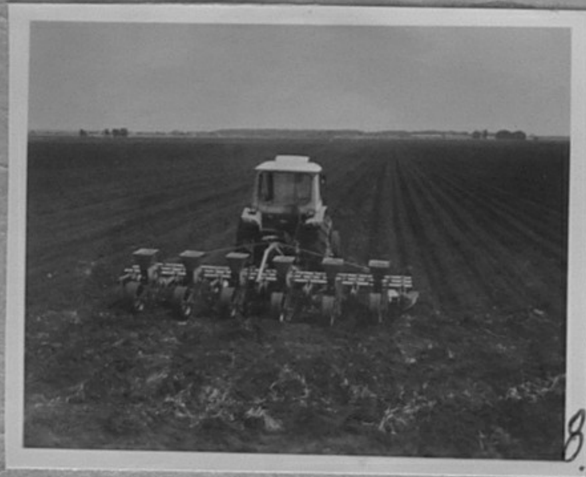
74-3842-5,7-Прибиране на фасул - Пловдивски окръг.