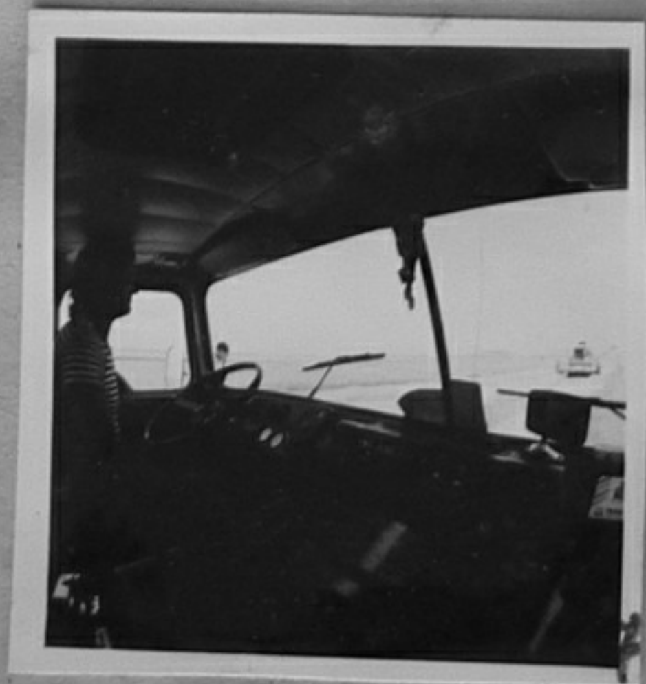
84-860-2 - Жътва в Хасковски окръг.