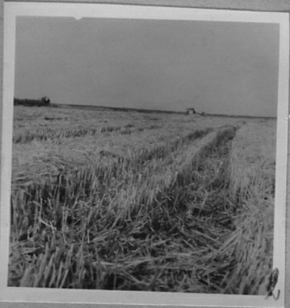
84-1323-2 АПК "Мало Конаре" жътва на ориз