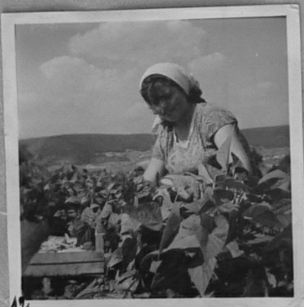
63/2194-12-Бране на зелен фасул в с. Нова Върбовка. /Чаръкчиев/ ММ