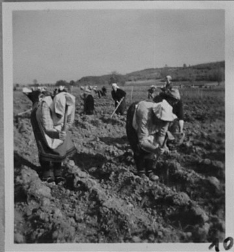
55/745-10-Засяване ръчно фасул в ТКЗС с.Черногорово, Хасковско. /ММ/