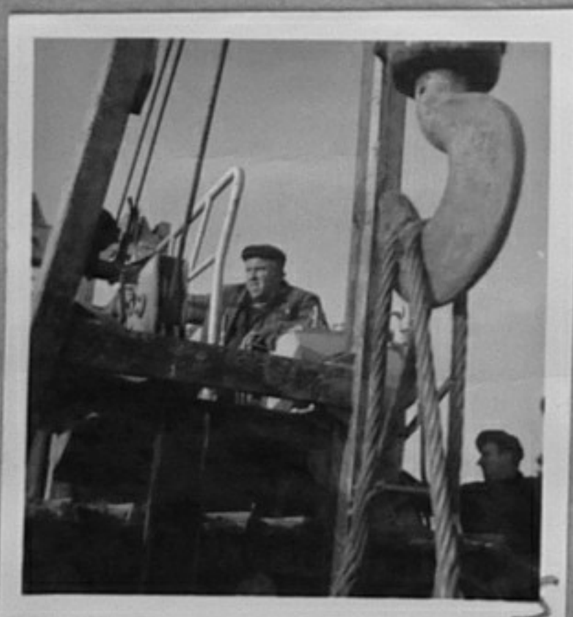
75-396-1, 2, 3-Строежът на газопровода СССР - НРБ.