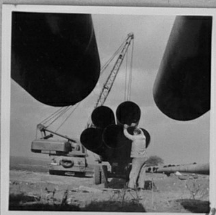
73-5154-12-Товарене на готовите тръби-тройки.