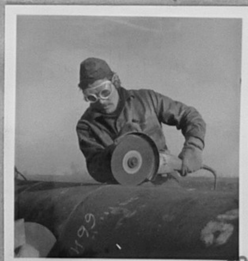
75-395-2,3,10-Строежът на газопровода СССР - НРБ.