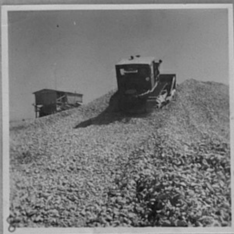
60/2951-2,6 - Строеж на новото летище във Варна. /Парушев/ ММ