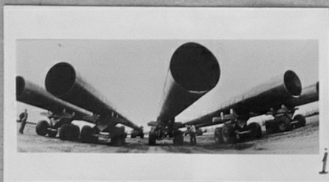
77-2797-1-"Тръбовози".