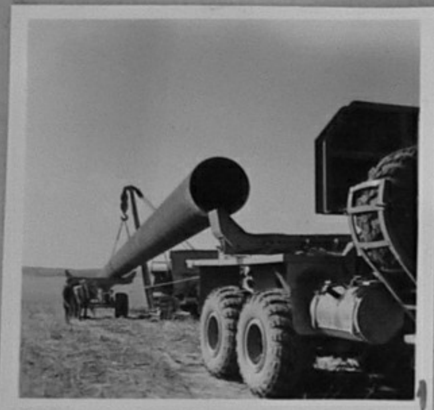
Газопроводът СССР-България. 73-5154-1-Товарене на готови тръбовози.