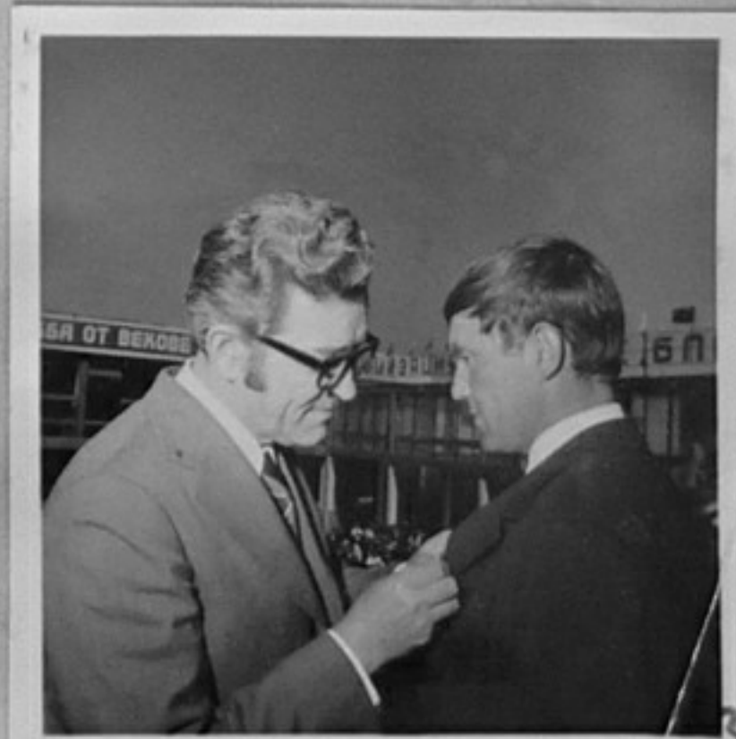
74-4026-3-Председателят на Мин. съвет и член на Полит- бюро на ЦК на БКП Ст. Тодоров връчва награда на строител на газопровода "Дружба".