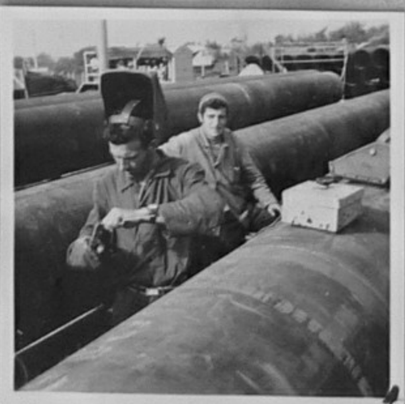
65/635-7, 8, 11- Както кадър 3. /Р. Парушев/ ЗН