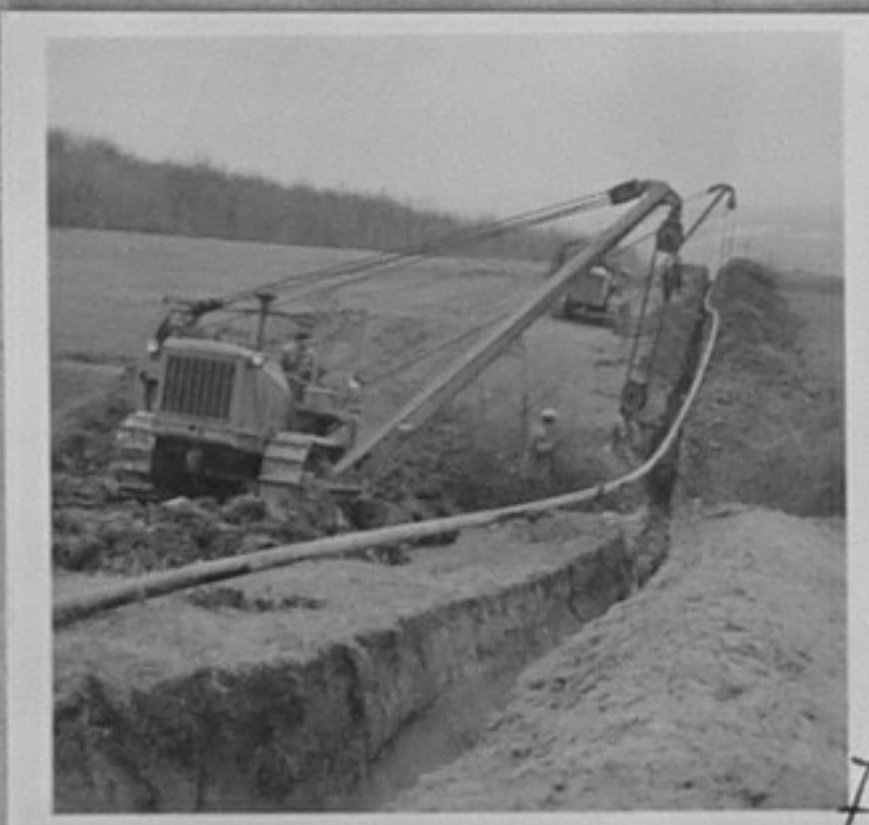
ГАЗОПРОВОДЪТ НОВО ОРЯХОВО-БЕЛОСЛАВ. Същият ще има дължина 27 км и ще свързва газов. находище в с. Ново Оряхово с ДИП "Стойко Из. Пеев", с. Белослав. 1- Изолация на места на свързв. на тръбите. 3, 5- Полагане на стоманените тръби в изкопа от комплексната монтажна бригада на Ат. Евтимов.