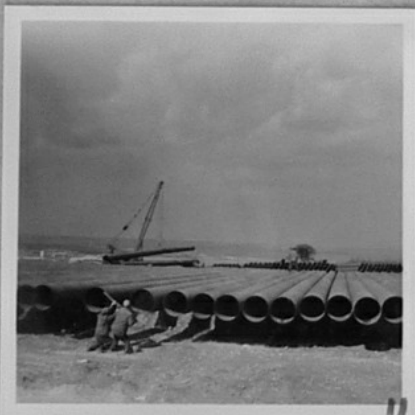
ръководител Кало Калов - заваряване на тръби-тройки.