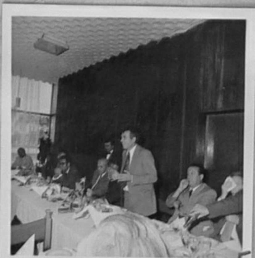
74-4030-11-Тържествен ми- тинг при откриването на га- зопровода "Дружба" Враца.