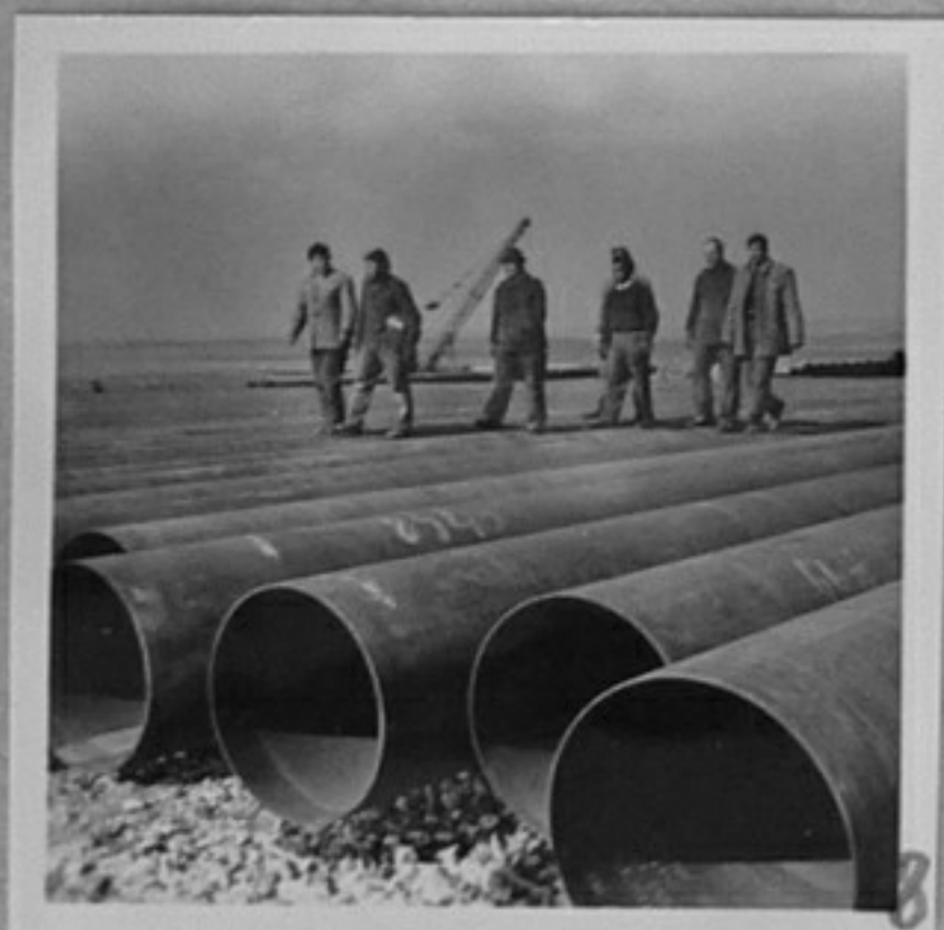
Газопроводът СССР-България. 73-5154-8,11,12-Бригадата с