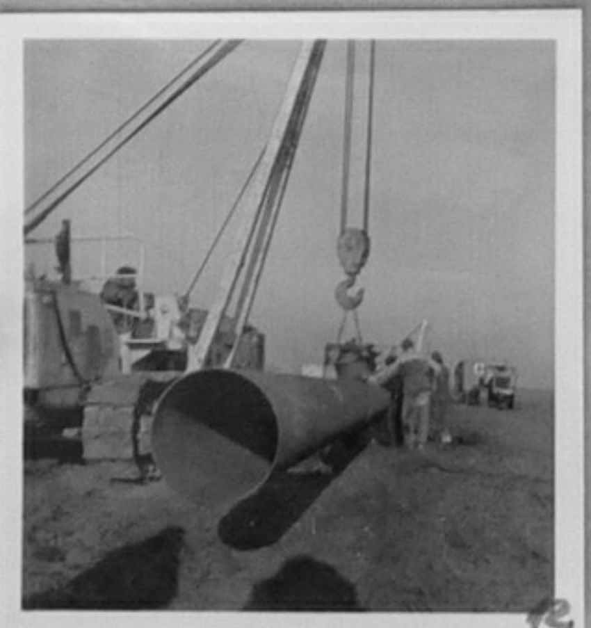
75-395-11,12-Строежът на газопровода СССР - НРБ.