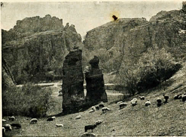
Бѣлоградчикъ. „Адамъ и Ева“

Изгладени повърхности по Витоша не сѣмъ срещалъ, но тѣ едва ли биха могли да се намерятъ, тъй като мѣстата, на които бихме могли да предпологаеме тѣхното сществуване, сж покрити отъ растителностъ. За еретични блуждающи блокове бихме могли да считаме блоковетѣ, които срещаме отъ „Камицитѣ“ надолу къмъ „Сврачара“, тъй като тѣ лежатъ върху чужда за тѣхъ основа, обаче наличността по тѣзи мѣста и на тѣи наречения Люлински конгломератъ (терциеренъ), който включва въ себе си сжщо такива блокове, не ни дава право да ги считаме безусловно за такива. Каменитѣ рѣки и други подобни образувания, за които бѣше погоре думата, считамъ и азъ, както и повечето отъ