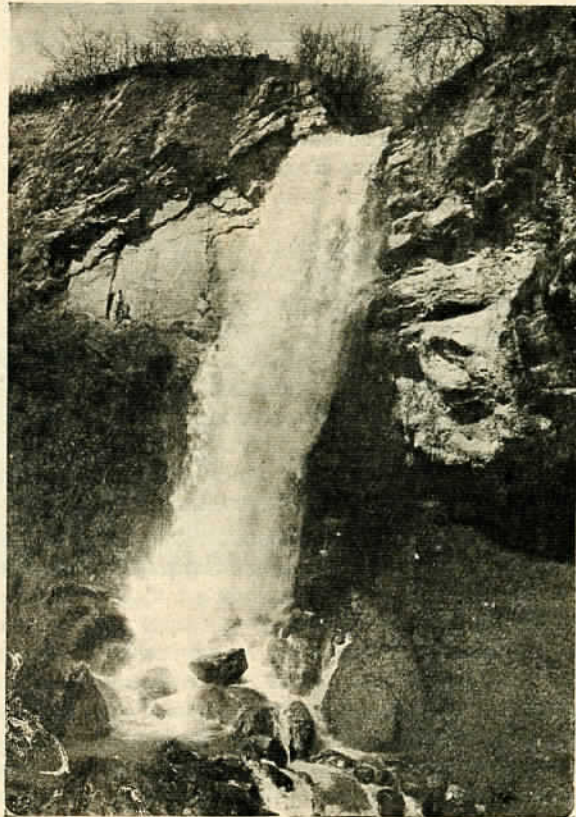
Водопадъ въ Пашмакли

година въ родния си градъ, направи новъ опитъ да продължи образованието си и следъ претърпяната неудача, остана за подначалникъ въ Министерството на Просвѣтата. На следната година се снабдява съ степендия по философия и педагогия въ Иена. Изъ различнитѣ университетски градове на Европа младиятъ Шишмановъ се отдава на плодoносна научна