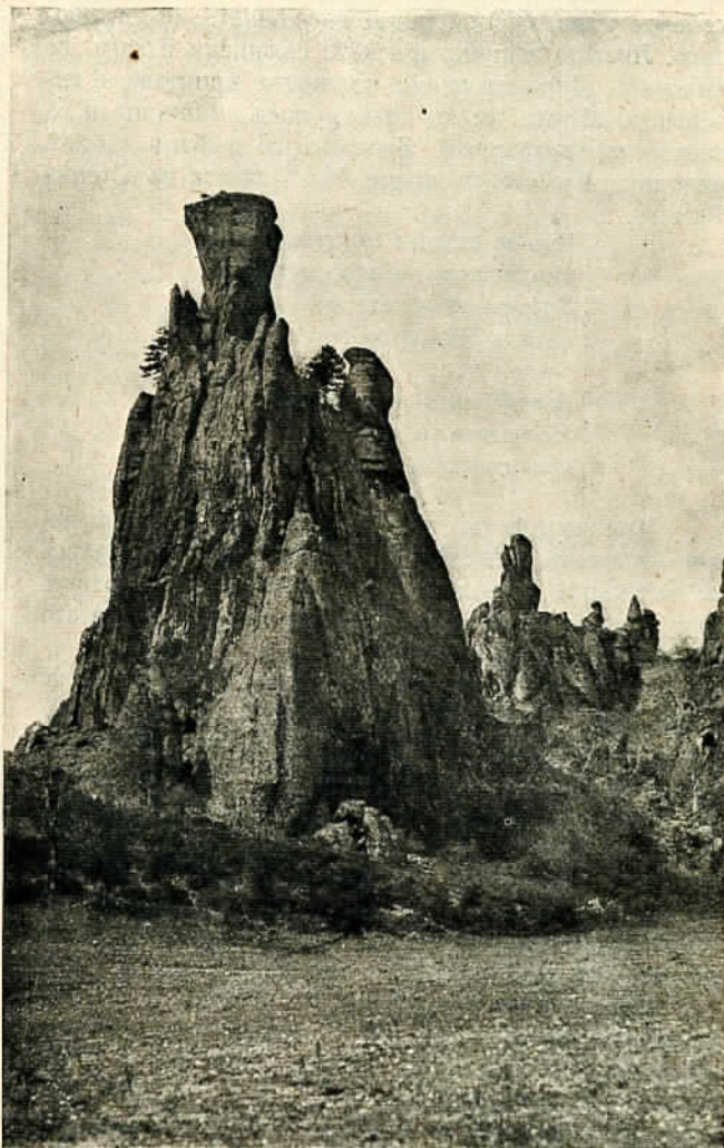
Бѣлоградчикъ. Боровъ камъкъ

Тука тамъ на раздалечъ по черната водна поляна свѣтватъ и огасватъ пламъчета. Сжщински блѣскунки. Свѣтлинката имъ трепти, вие се като гърчеше се свѣтло змийче изъ тъмната водна глѣ-